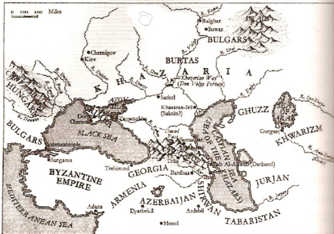
Carta dei territori dell'Impero Khazaro

L'imperatore Leone III arrivò addirittura a dare in moglie a suo figlio Costantino ( poi Costantino V copronimo ) la principessa Khazara TziTzak e, non a caso, il loro figlio Leone IV passò alla storia con il soprannome di "Leone il Khazaro".