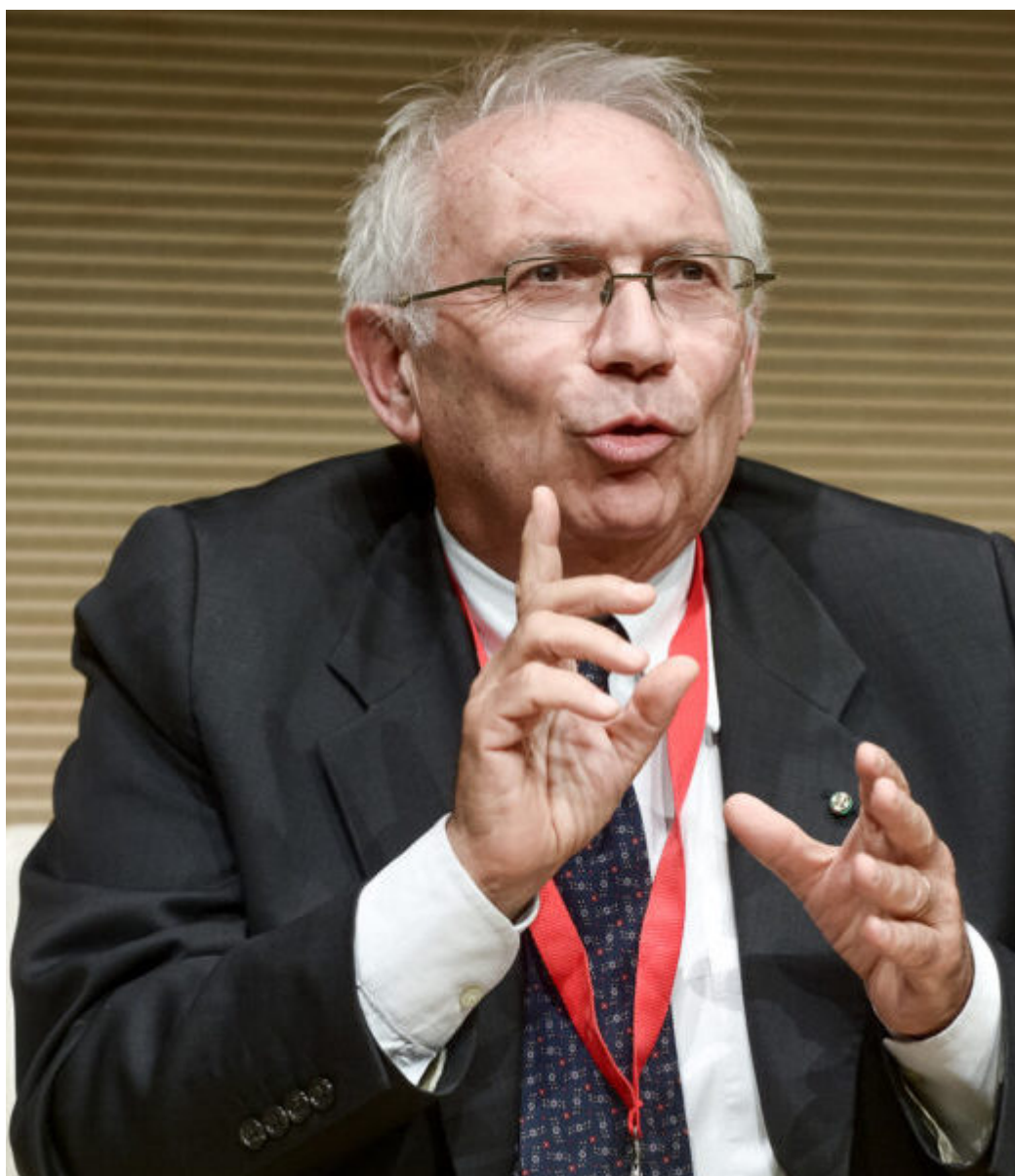
Il Ministro dell'Istruzione Patrizio Bianchi

ricercatore alla Facoltà di Economia all'Università di Trento. Due anni dopo è a Bologna, dove ha vinto la cattedra di Professore Associato, e dove nel 1994 è diventato Professore Ordinario di Politica Economica, Dipartimento di Scienze Economiche.