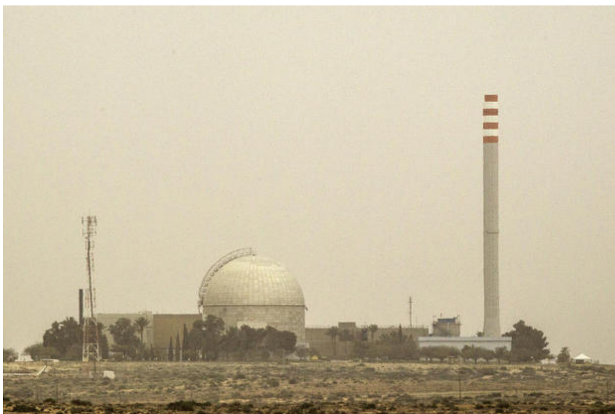
Il complesso militare nucleare israeliano di Dimona