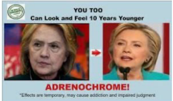
Adrenochrome - Eternal Yout... theapparitionmissi.wixsite.c...