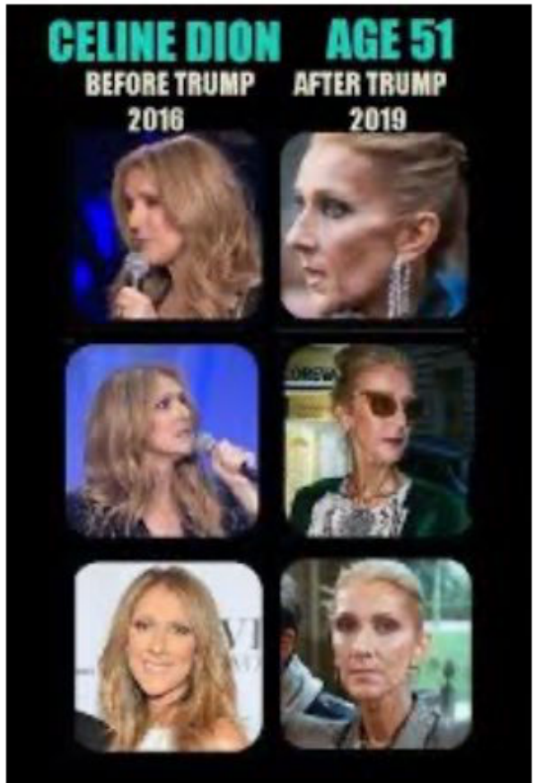
ADRENOCHROME shortage