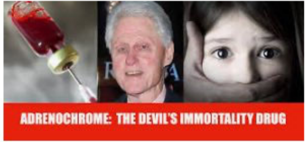
Child Adrenochrome: Globali... shadolsonshow.com