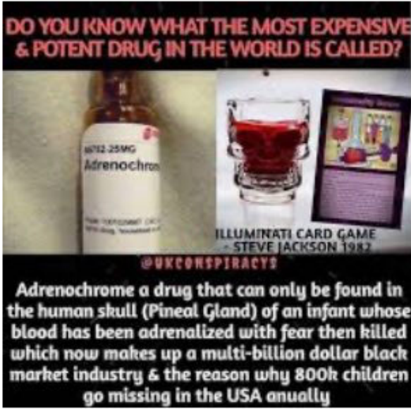
Adrenochrome the drug of d... thejusticeheroes.wordpress...