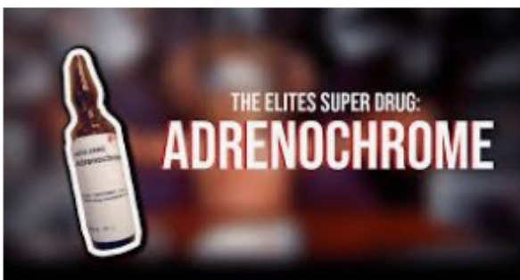
The Elites Super Drug: Adren... scarenormal.com