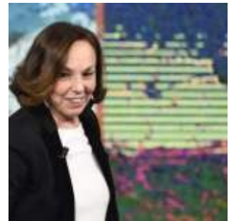
In obbedienza agli ordini scaduti

Ma perché? Nel collasso dell’economia globale, di quella italiana e della produzione industriale anche tedesca, si continua ad obbedire all’ordine : “importare manodopera, ne abbiamo bisogno”