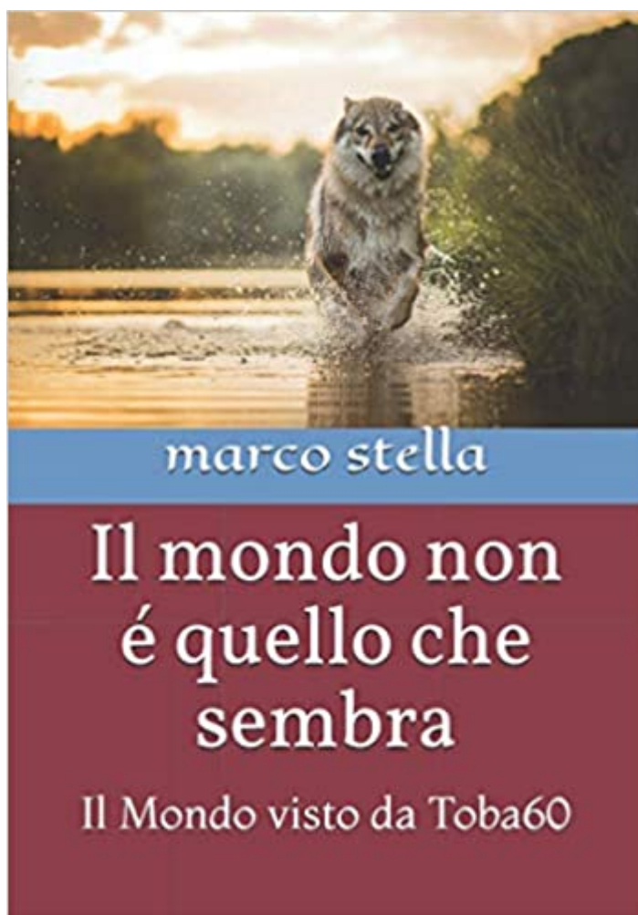
Il mondo non e' quello che sembra

“Il piano è stato sviluppato molti anni fa, ma per decenni è rimasto come un semplice piano. Hanno dovuto aspettare molti anni fino a quando la tecnologia appropriata è stata scoperta prima che il piano potesse essere implementato. Mancava la tecnologia dell’ mRNA . Ma era anche necessario crescere e formare le persone giuste per implementarlo.