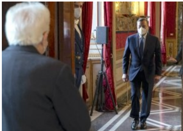
Il misterioso trattato del Quirinale Leggi subito