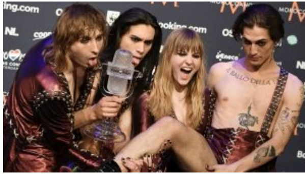
La sinistra Maneskin Leggi subito