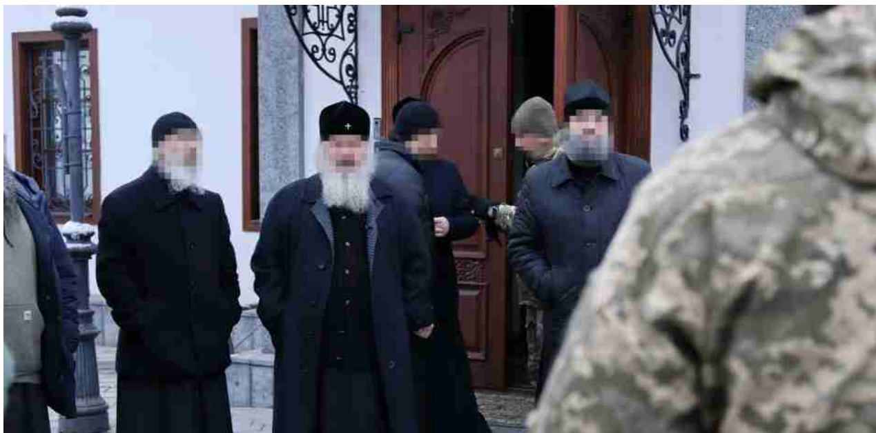
Retata Chiesa ortodossa

Lo scorso venerdì, la SBU ha sporto denuncia contro il metropolita della diocesi di Kirovohrad della Chiesa canonica ortodossa ucraina (UOC) per presunte “attività sovversive contro lo Stato” e “incitamento all’odio religioso”.