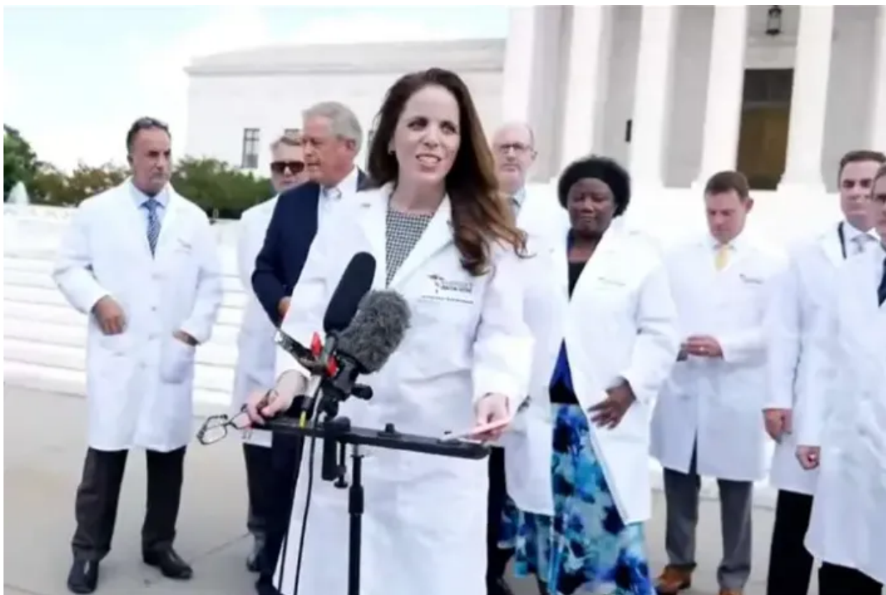
Simone Gold Di America's Frontline doctors

Uno “studio sulla biodistribuzione” di un ente di regolamentazione giapponese ( leggi sotto ) sugli effetti del vaccino Pfizer dà credito all’idea che il DNA nelle cellule riproduttive umane può essere modificato. È stato riscontrato che i testicoli e le ovaie hanno livelli notevolmente elevati di proteina spike, che è codificata dall’mRNA del vaccino.