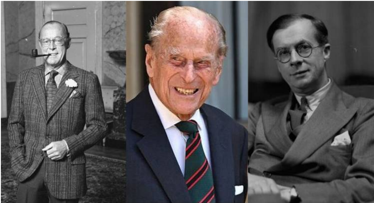
Three useless eaters fond of projection: Prince Bernhard, Prince Philip and Sir Julian Huxley

In un'intervista dell'agosto 1988 con Deutsche Press Agentur, il principe Filippo ha proclamato il suo desiderio di tornare nella prossima vita come un virus mortale per aiutare a "risolvere la sovrappopolazione". [NDR: Filippo non aveva bisogno di rifarsi a fantomatiche sue preferenze "naziste" quando disse tali cose: gli bastava riferirsi alla tradizione tipicamente anglo di Thomas Malthus (176-1834, che progettò la riduzione della popolazione povera)]