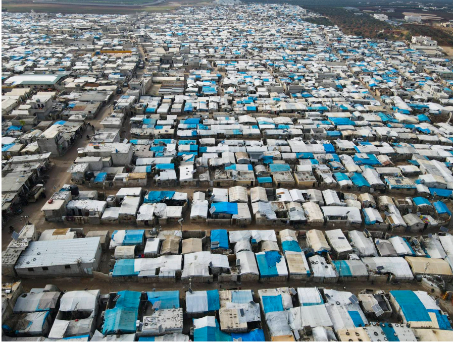
Il campo di Karama ospita alcuni degli oltre due milioni di sfollati siriani nella provincia di Idlib.

I servizi pubblici nel nord-ovest della Siria sono stati gravemente colpiti dalla guerra civile scoppiata nel 2011. L'area in gran parte controllata dall'opposizione ospita milioni di sfollati a causa del conflitto, molti dei quali vivono nei campi.