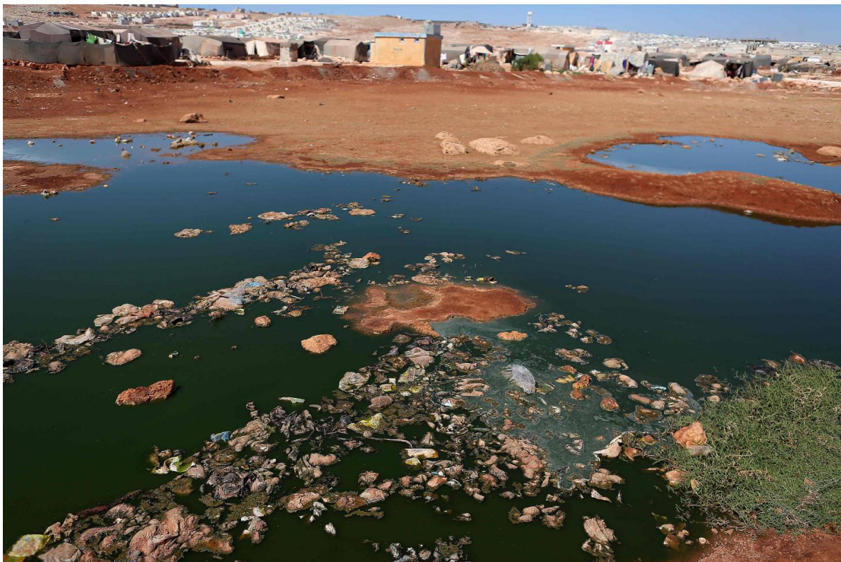
Una pozza di acque reflue in un campo per sfollati interni nella città di Sarmada, nella provincia nord-occidentale di Idlib in Siria.