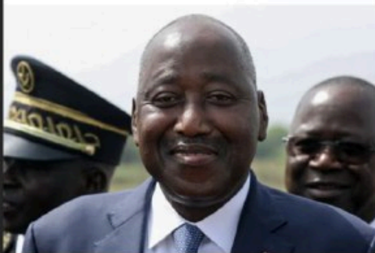
Amadou Gon Coulibaly died on July 8, 2020 at the age of 61

Coulibaly's death throws Ivory Coast into uncertainty as he is also the ruling RHDP's presidential candidate.