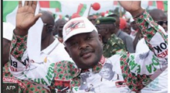
Pierre Nkurunziza was campaigning for his party's candidate in last month's presidential election

Burundi's President Pierre Nkurunziza, aged 55,