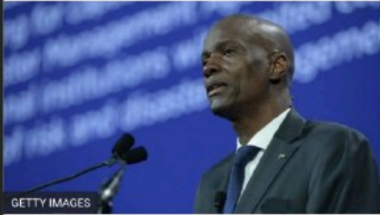
Haiti President Jovenel Moise

On Wednesday tori of di assassination of Haiti president, Jovenel Moise shock many as unidentified assassin kill on for his house