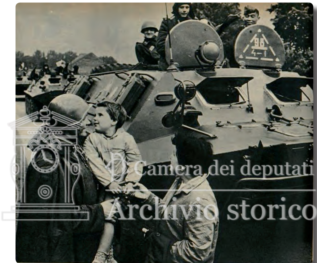
Panorama, 13 agosto 1968