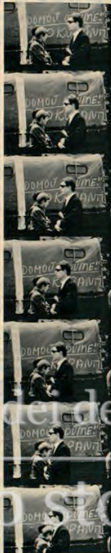
Il 20 agosto il Patto di Varsavia ha rivelato la sua vera natura di strumento di dominio sovietico. E i cecchi, come mostra la sequenza dei fotogrammi, hanno scritto su questo e su altri veicoli russi: « Domov udime! Okupanti » (Tornate a casa! Invasori).