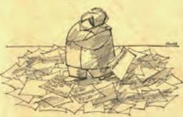
Was souverän ist, bestimmt sich!

Die Invasion der Russen in die CSSR ist ein Ereignis, das die Welt erschauern muß. Denn die Invasion der Russen in die CSSR ist nicht nur ein Ereignis, das die Welt erschauern muß, sondern ein Ereignis, das die Welt erschauern muß. Denn die Invasion der Russen in die CSSR ist nicht nur ein Ereignis, das die Welt erschauern muß, sondern ein Ereignis, das die Welt erschauern muß.