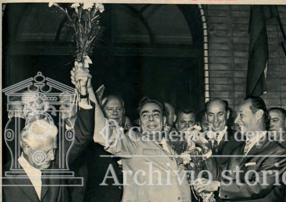
2 agosto 1968: i colloqui di Cierna sono appena finiti. Dirigenti russi e cecoslovacchi (in primo piano Svoboda, Breznev e Dubcek) spargono fiori e sorrisi. L'illusione della fratellanza durerà poco.