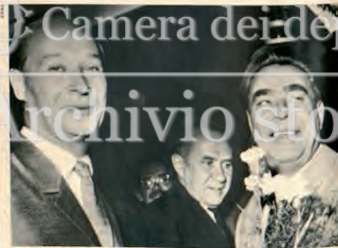
A BRATISLAVA, Walter Ulbricht, a sinistra, al suo arrivo a Bratislava per partecipare al vertice comunista. Alle sue spalle è il cecoslovacco Alexander Dubcek. Sopra, Alexei Kossighin e Leonid Breznev insieme a Dubcek.