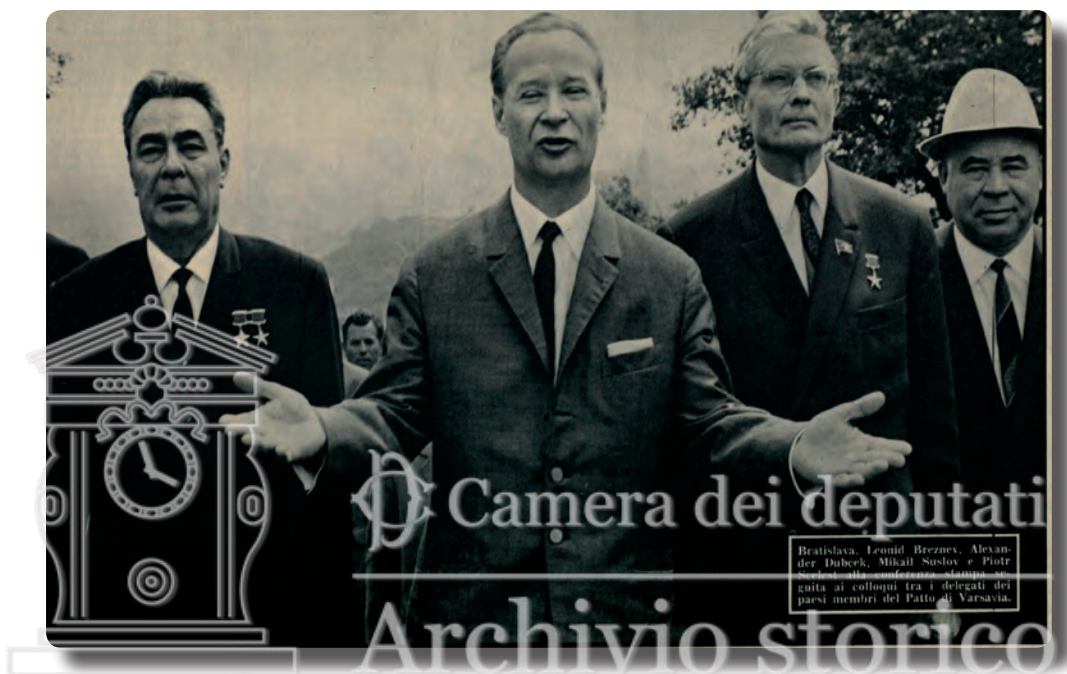
L'Espresso , 25 agosto 1968 Dubček tra Breznev e Suslov, in una foto del 3 agosto 1968