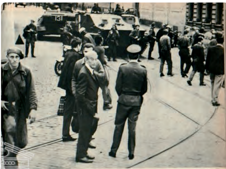
ENTRANO I CARRI ARMATI. I mezzi corazzati russi sono entrati a Praga nella notte tra il 20 e il 21 agosto. Sopra, pacifantissimi sovietici in pieno assetto di guerra, nelle prime ore del 21 agosto, in una strada di Praga. A sinistra, mezzi corazzati sovietici davanti alla sede del comitato centrale del partito comunista cecoslovacco a Praga. A destra: carri armati sovietici nei dintorni di Praga.

La reazione popolare è stata unanime. Le due stazioni radio ancora in funzione dopo l'invasione, quella di Pilsen e di Ceske Budeovice, leggevano la continuazione la valanga di risoluzioni votate in tutte le fabbriche e le fattorie della zona. Erano sempre risoluzioni di solidarietà a Dubcek, di condanna dell'intervento armato.