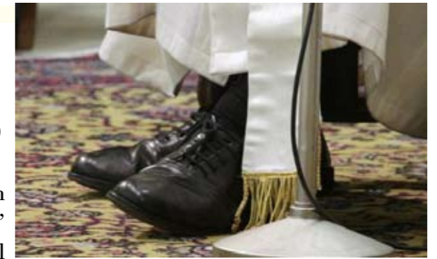
Le scarpe nere e “vissute” di Francesco

La storia, la puoi scrivere anche con le scarpe. Come quelle nere e “vissute” che si scorgono sotto l'abito bianco del papa venuto da lontano. Dalla fine del mondo. Ci parlano della trasformazione del pontificato messa in moto da Francesco, più di qualsiasi discorso o gesto esplicito. Si può addirittura marcare la scansione di certe epoche storiche, nella fase critica della transizione da una all'altra, segnando il momento cruciale del passaggio con episodi legati a calzature diventate celebri, non per la loro eleganza, ma per la loro consumazione.