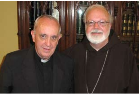
I cardinali Bergoglio e O'Malley

che non può restare un suo tratto personale da contemplare e ammirare ma diventa necessariamente un modello da seguire. Peraltro quasi quotidianamente confermato e rafforzato da decisioni e scelte di inequivocabile significato. Quando il pontefice argentino fa sapere che risiederà nella Domus Sancta Marthae, la residenza vaticana dove hanno alloggiato i cardinali durante il conclave e dove normalmente abita qualche dozzina di preti e vescovi in servizio all'interno del Vaticano, quale principe della chiesa, d'ora in poi, potrà concedersi residenze sfarzose con vasche Jacuzzi e biancheria intima Dolce e Gabbana? Tanto più, a chi non l'avesse ancora capito, il papa fa sapere attraverso il suo portavoce il perché della scelta: è una «forma di abitazione semplice e in convivenza con altri sacerdoti e vescovi», spiega padre Federico Lombardi, e «pensa di vivere in modo normale e molto semplice». Rimanendo a Santa Marta, aggiunge il portavoce, Francesco potrà vivere «insieme ad altri membri del clero», rifiutando invece il lussuoso isolamento dell'appartamento pontificio.