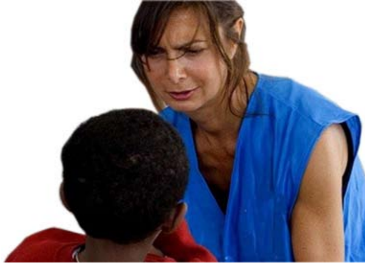
Laura Boldrini in missione umanitaria

che Enrico Letta entri nel Quirinale, per ricevere l'incarico da Napolitano, al volante della sua Fiat Ulisse. E che Nicola Zingaretti arrivi alla Pisana, la sede della Regione Lazio, guidando la sua Renault Scenic. E al termine della prima riunione della nuova giunta proclama: «Tutti gli assessori verranno a lavorare in ufficio con i propri mezzi di trasporto. Abbiamo preso questa decisione con grande gioia. Le automobili a disposizione della Regione verranno utilizzate in occasione degli incontri e degli eventi istituzionali perché è giusto rappresentare l'istituzione come si deve».