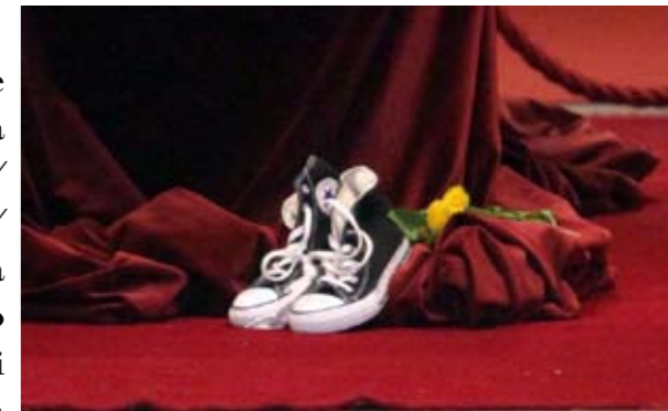
Un paio di scarpe da tennis accanto alla bara di Jannacci