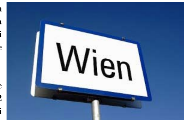
Vienna indica la via verso la qualità della vita

Come a Vienna. «Nel referendum popolare concluso da poco, i cittadini hanno bocciato al 72 per cento una possibile candidatura alle Olimpiadi estive del 2028, infischiosene delle promesse di crescita da capogiro sventolate dal palazzo». Così racconta Flavia Foradini sul Sole 24 Ore il 24 marzo scorso l'esito dell'ultima consultazione popolare a Vienna – diverse ce ne sono state nel corso degli ultimi vent'anni - che comprendeva anche altri quesiti. Così, i viennesi hanno anche deciso che «non vi sarà privatizzazione di servizi primari: acqua, smaltimento rifiuti, ospedali, edilizia popolare, produzione di energia resteranno comunali. E oltre alle quattro centrali fotovoltaiche finanziate di recente dai cittadini, di cui due già in funzione e altre due attive entro l'anno,