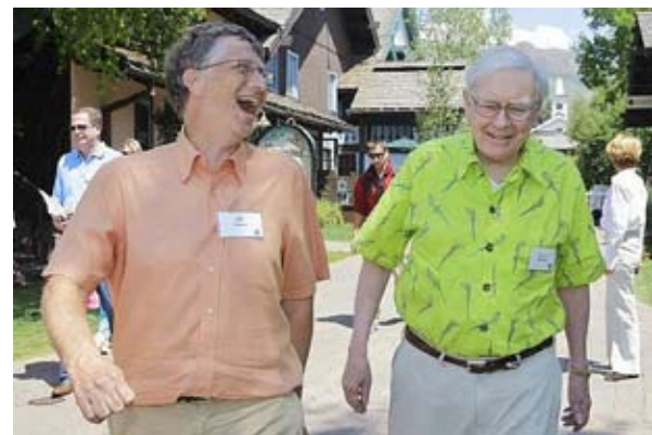
Bill Gates e Warren Buffett a Sun Valley nel 2012