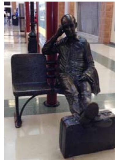
La statua di Adlai Stevenson a Bloomington e, in basso, una sua foto

Sì, basta un banale paio di scarpe, una suola logorata e consumata, un colore eccentrico o comune, per raccontare un'epoca e le sue contraddizioni. Nell'atrio del Central Regional Airport di Bloomington, nello stato dell'Illinois, c'è una statua bronzea di Adlai Stevenson II, la posa del passeggero in attesa di un volo, seduto su una panchina, le gambe distese e accavallate, e poggiate su una valigia. E ben in vista un clamoroso buco nella suola sinistra. Di famiglia patrizia e benestante, una dinastia di politici illustri, l'aspirante presidente degli Stati Uniti, era stato al centro delle cronache per il suo legame romantico con Lauren Bacall e con l'icona del Washington Post Katherine Graham, e per i suoi ripetuti e vani tentativi di conquista della Casa Bianca. Tra questi, l'inutile sfida nelle primarie democratiche nel 1960 contro John Kennedy. Seppure più volte sconfitto, resta nella storia politica