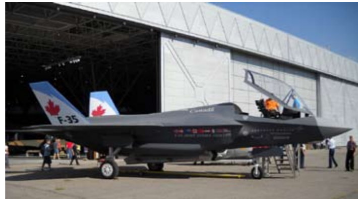
Il caccia multiruolo F-35

Un tempo sarebbe stato argomento intrattabile per la politica, anche per i partiti di sinistra, ma oggi lo scandalo degli F-35 è messo in piazza dalla «bibbia» dell'industria aerospaziale, Aviation Week & Space Technology . Che ha aperto la diga al torrente di critiche nei confronti del progetto del caccia multiruolo (che interessa anche l'apparato militare-industriale italiano e le nostre forze armate) sia per la consistente lievitazione dei suoi costi sia per i numerosi e pesanti problemi che presenta l'aereo. Ma perfino per la sua stessa efficacia strategica, che è messa in questione da diversi punti di vista. Il Pentagono ha ordinato 2.457 jet, 396 miliardi di dollari, il doppio di quanto preventivato nel 2001. A cui vanno aggiunti cinque miliardi di dollari, già spesi, per i pezzi di ricambio necessari per la flotta di aerei già in dotazione, dato il protrarsi dei tempi della messa in produzione di nuovi caccia. Dovuta a sua volta all'emergere di una varietà di rilevanti guai tecnici e tecnologici. Infatti, le forze armate americane hanno dovuto già spendere 373 milioni di dollari per riparare gli aerei acquistati e in operazione. Si prevede che, alla fine, la spesa per le riparazioni arriverà a otto miliardi di dollari. Un'arma costosa, problematica, inaffidabile, dunque. E inutile nell'epoca degli aerei senza