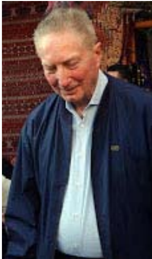
Un'immagine "informale" del cardinal Martini

L'informalità di questo papa è inevitabilmente messa in contrappunto con l'enfasi formalista del suo predecessore, un raffronto che irrita chi, dentro e fuori del Vaticano, si sente minacciato da un personaggio che, essendo la guida della chiesa, propone, con il suo esempio, uno stile a cui uniformarsi. Uno stile