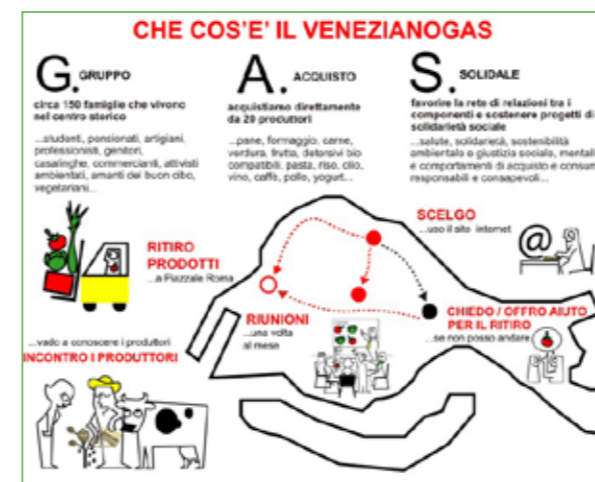
il sito di VenezianoGas

Quest’edificio del Quattrocento, che era la sede della confraternita dei calzolari veneziani, è oggi del Comune, che lo concede per riunioni pubbliche, come