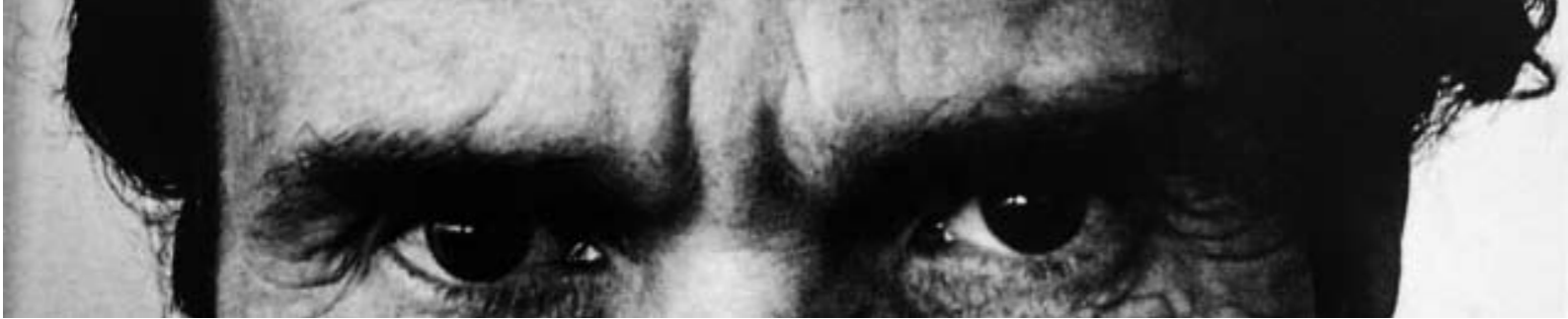
Pier Paolo Pasolini

nuttata”. Si capisce che non siamo semplicemente dentro un ciclo congiunturale negativo, ma dentro una crisi del capitalismo stesso. Ecco perché certe idee di nuova società, forse ancora immature fino ai tempi recenti, si fanno strada e, di converso, certi comportamenti di spreco e di ostentazione invidiati e considerati segni di status symbol, ora appaiono stridenti e insopportabili. Non è solo la campagna contro la casta a rendere grottesca e odiosa l'auto blu. Quando è il papa argentino a scegliere di andare a piedi lasciando esterrefatti il suo seguito di porporati e guardie del corpo, e tutti applaudono, significa che il clima generale è andato molto più avanti rispetto a quello del pur legittimo e comprensibile risentimento verso i potenti e i loro privilegi. Significa che il mondo sta forse davvero imboccando con convinzione la strada indicata da papa Francesco.