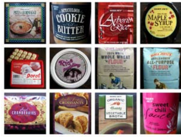
Sugli scaffali di Trader's Joe

della normalità. «Ero rapidamente diventato insensibile a tutto questo. Il nuovo telefono Nokia non mi eccitava né mi bastava. Non ci volle molto perché cominciassi a chiedermi perché, con la mia vita, teoricamente migliorata, non mi sentissi per niente meglio perché anzi mi sentissi più ansioso di prima». E continua: «La mia vita era inutilmente complicata. C'erano prati da rasare, grondaie da ripulite, pavimenti da lucidare, ospiti da accudire (sembrava da sciocchi avere una casa così quand'era vuota), l'auto da assicurare, lavare, rifornire, riparare, pagare il bollo e sapere di tecnologia per farla funzionare. Oltre a tutto questo, dovevo tenere Seven occupato. Ma davvero, un personal shopper ? Che cosa ero diventato? La mia casa e le mie cose erano i miei nuovi datori di lavoro per un lavoro che non avevo mai richiesto».