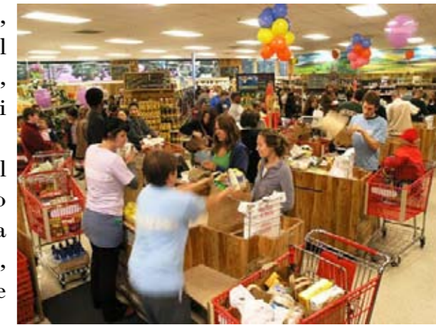
Fare la spesa spensieratamente da Trader's Joe

In quest'ultimo decennio e, soprattutto negli ultimissimi due-tre anni, nel paese sinonimo del consumismo senza freni oggi le parole in voga sono « frugalist » e « bargainist ». Frugale e incline al « bargain », alla ricerca dell'affare e del prezzo scontato o contrattabile. Una cultura che si afferma innanzitutto nelle aree metropolitane e, in particolare, in un certo tipo di quartieri, come quelli vicini ai campus universitari o notoriamente liberal . Per capire il fenomeno basta visitare