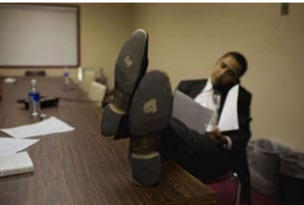
Barack Obama a Providence nel 2008

scarpe, confidò a Collie, erano già state risuolate. A rimarcare quant'America aveva attraversato a piedi per guadagnarsi la presidenza.