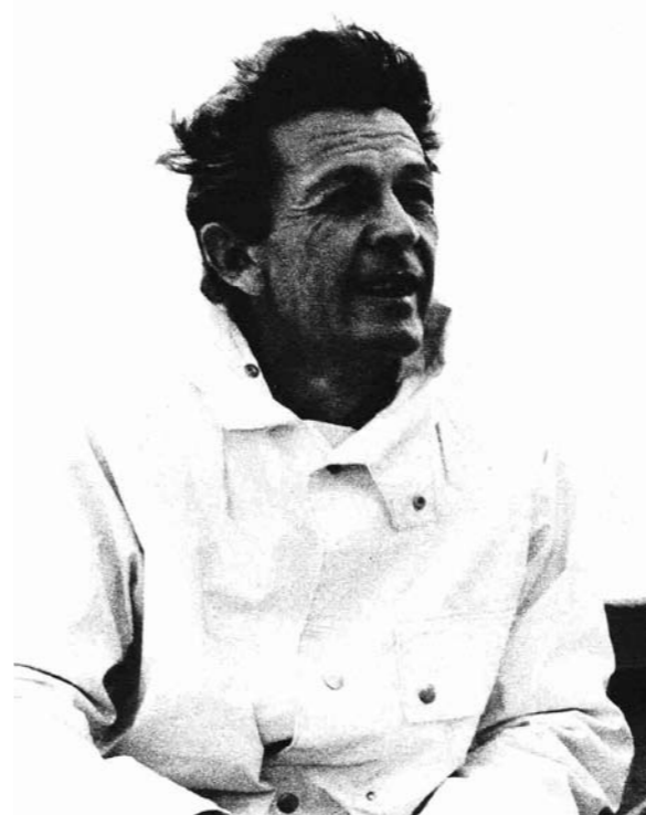
Berlinguer in barca a vela nella sua Sintino

Quando Enrico Berlinguer, in due importanti discorsi del 1977, a Roma e a Milano, propose l'austerità quale chiave culturale e politica per costruire un nuovo modello di sviluppo, ebbe più critiche che consensi. «Per noi l'austerità, spiegò il segretario del Pci, è il mezzo per contrastare alle radici e porre le basi del superamento di un sistema che è entrato in una crisi strutturale e di fondo, non congiunturale, di quel sistema i cui caratteri distintivi sono lo spreco e lo sperpero, l'esaltazione di particolarismi e dell'individualismo più sfrenati,