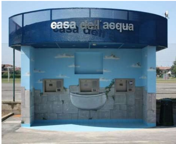
Un erogatore d'acqua in Lombardia

di Venezia, unica al mondo, ma anche «la città conosciuta per la sua acqua che gira il rubinetto per ridurre l'immondizia», come recita il titolo del quotidiano americano. Sarà perché gli italiani sono «i principali consumatori al mondo di acqua in bottiglia», certo è che fa notizia il successo, al di sopra delle aspettative, dell'iniziativa dell'amministrazione veneziana. Nel febbraio 2008 Cacciari, insieme all'attore Marco Paolini, aveva sposato la campagna di don Gianni Fazzini a favore dell'uso della cosiddetta acqua del sindaco. «L'acqua è come l'aria, un bene pubblico che appartiene alla comunità e non può essere commercializzato», aveva detto il l'ex prete operaio, responsabile della Pastorale per gli stili di vita della diocesi di Venezia, proponendo il digiuno dall'acqua in bottiglia, per prepararsi alla Pasqua e