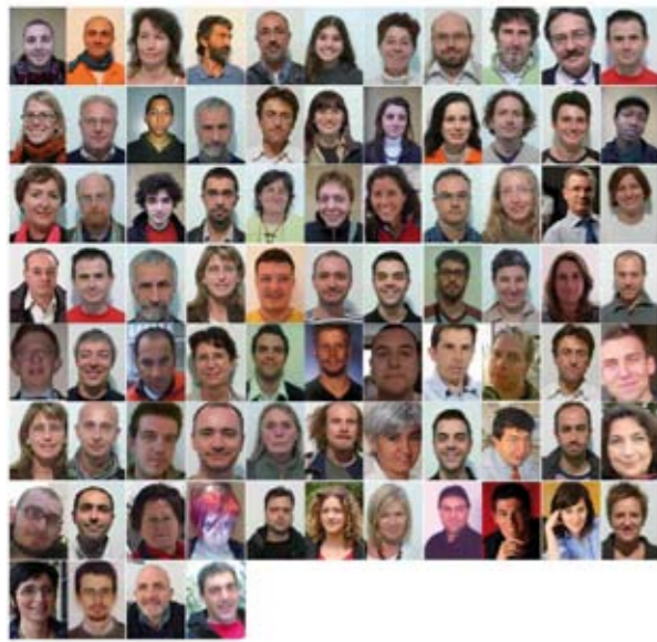
Autostop in città. A Trento

urbano che “sfrutta” il flusso naturale di automobili già in movimento (diversamente dal car sharing e dal car pooling , che utilizzano auto precedentemente “prenotate”). Il tutto funziona come un autostop di massa orchestrato da una centrale operativa: ogni persona che aderisce all’iniziativa deve, al momento del passaggio, esibire una card , rilasciata solo a chi non ha precedenti penali e stradali (“questo rende il sistema molto sicuro, a differenza dell’autostop”, spiega l’ideatore Enrico Gorini) e se nota irregolarità nella condotta di chi guida può segnalarlo al gestore del sistema. Al termine del percorso il passeggero rimborsa il pilota con un ticket, prefissato da Jungo, e bastano uno o più passaggi per risparmiare sui costi e sulla ricerca di un parcheggio. Il tempo medio di attesa è di circa sei minuti, il movimento conta quasi mille aderenti e ha referenti in undici città del nord Italia. Si tratta ancora di un esperimento pilota, ma ci sono buone possibilità che segni l’inizio di un nuovo modo di concepire i trasporti su strada».