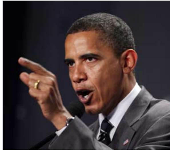
Barack Obama dà la linea

Ma la pensione, pur rispettabile, diventa sicuramente la voce di reddito minore per un ex-presidente che ha acquistato notorietà con il suo mandato. Oggi Bill Clinton è un uomo ricco. Dichiarò un reddito netto di 55 milioni di dollari, grazie alla sua attività di conferenziere e di autore di libri. Lo scorso gennaio, riferisce l' Huffington Post , l'ex-presidente è riuscito a saldare i cospicui debiti accumulati da Hillary nel corso della campagna presidenziale del 2008. Obama sarà sicuramente ancora più ricco. Già intasca parecchio grazie ai due best seller autobiografici che