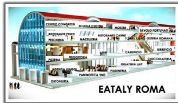
Eataly nell'ex-stazione Ostiense a Roma

Hansel di Piacenza è la traduzione italiana ante-litteram del vangelo di Ducasse. Anche in Italia – dove la ristorazione non è ancora come in Francia ma presto potrebbe esserlo – avremo la certezza di entrare in un ristorante dove dietro i fornelli c'è un vero chef con i suoi assistenti che cucinano davvero e non ti propinano pietanze comprate dai grandi distributori all'ingrosso, se i locali piccoli come quello di Hansel e il successo di aziende del cibo sano e buono che pensano in grande, come Eataly, faranno scuola e non si limiteranno a essere piacevoli eccezioni.