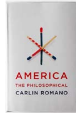
Carlin Petrini "icona" americana

dunque se stesso nel 2096 e scrive parole che fanno venire i brividi per la loro lucida lungimiranza ma che sono anche una poderosa iniezione di speranza: «La nostra lunga esitante, dolorosa ripresa, nel corso di cinque decenni, dal crollo delle istituzioni democratiche nel corso degli Anni Bui (2014-2034) ha cambiato il nostro vocabolario politico, così come il nostro senso di relazione tra ordine morale e ordine economico. Proprio come nel Ventesimo secolo era inquietante per gli americani immaginare come i loro antenati della preguerra civile avessero potuto digerire la schiavitù, così a noi, alla fine del Ventunesimo secolo, turba immaginare come i nostri bisnonni avessero potuto legalmente tollerare l'orrendo contrasto tra un'infanzia trascorsa nei quartieri residenziali e quella trascorsa nei ghetti. Simili ineguaglianze appaiono a noi evidenti abomini morali, ma la vasta maggioranza dei nostri antenati li prendeva come deplorabili necessità».