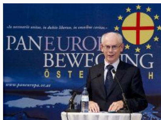
Il 16 novembre 2012 è stato conferito al presidente del Consiglio europeo Herman Van Rompuy il premio europeo Coudenhove-Kalergi 2012 durante un convegno speciale svoltosi a Vienna per celebrare i novant'anni del movimento paneuropeo. Alla sua spalle compare il simbolo dell'Unione paneuropea: una croce rossa che sovrasta il sole dorato, simbolo che era stato l'insegna del Rosacroce.