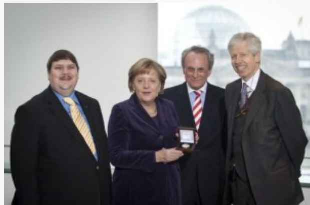
La Società Europea Coudenhove-Kalergi ha assegnato alla Cancelliera Federale Angela Merkel il Premio europeo nel 2010