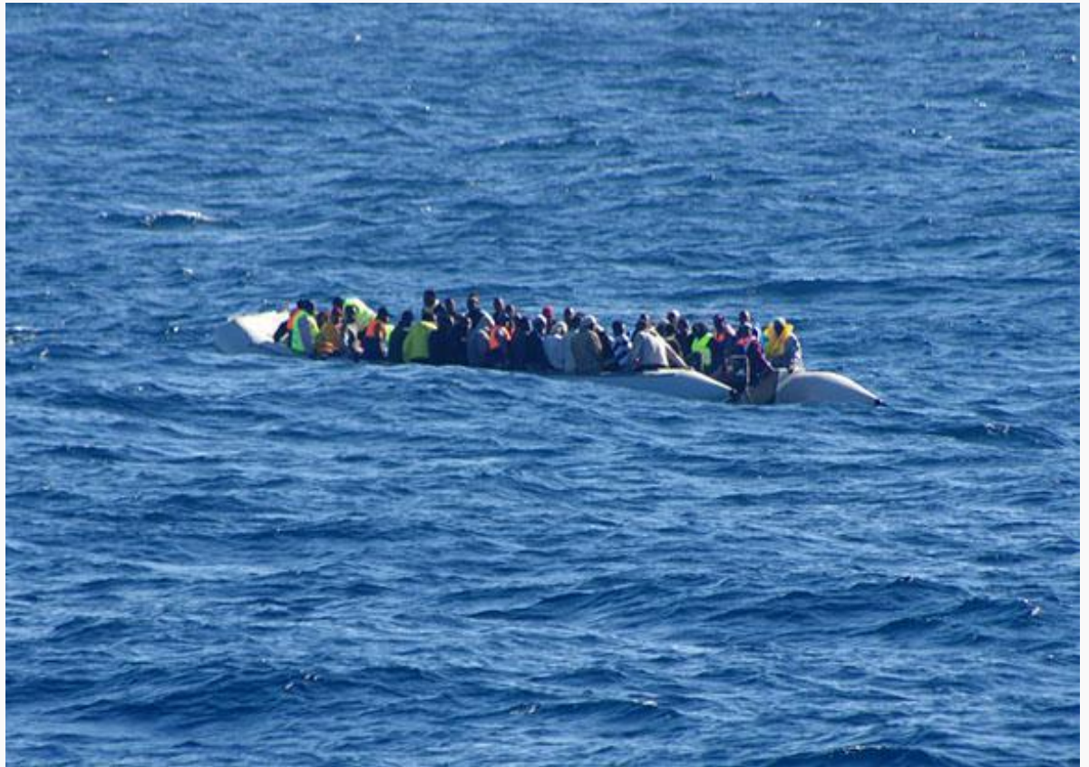
Naviglio ostile, per il nuovo paradigma.