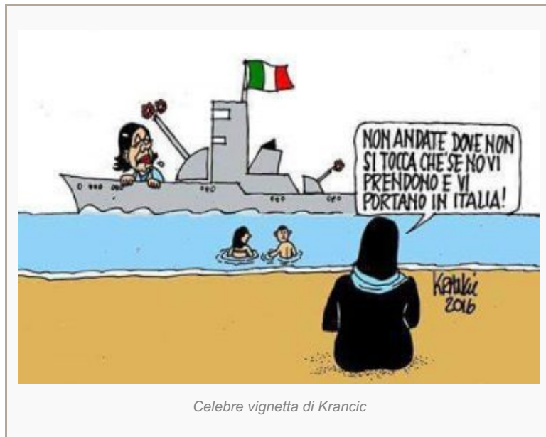
Celebre vignetta di Krancic

Né vale l’obiezione che sarebbe orrendo sparare e affondare barconi e gommoni, perché si tratta di civili, donne, bambini, “minori non accompagnati” (ossia maggiorenni che si fingono adolescenti). Perché scusate, di grazia, da quando in qua nelle guerre ibride ci si fa scrupolo dei civili? Forse che Israele non bombarda periodicamente gli inermi assediati di Gaza, anche con fosforo bianco? E non ammazza forse un giorno sì e uno no innocui pescatori che osano superare le 7 miglia per gettare le reti? E mica i nostri Tg protestano mai. Forse che l’aviazione Usa, mentre fa finta di liberare Mossul dai suoi terroristi dell’IS, che ha addestrato ed armato, non ammazza centinaia di civili? Cento oggi, duecento domani, fra le macerie coi terroristi islamici: li chiamano “danni collaterali”, l’IS li usa come scudi umani. E noi, cosa aspettiamo? Utilizziamo le risorse tattiche ed etiche che ci offrono col loro esempio la sola democrazia del Medio Oriente e la Superpotenza Morale!