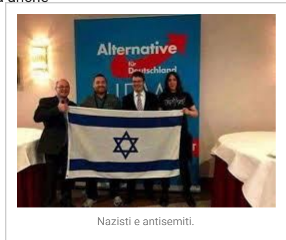
Nazisti e antisemiti.