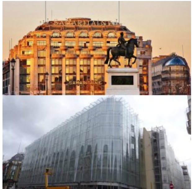
Parigi: “Inseri contemporanei” di archistar per irridere alla splendida coerenza urbanistica – di cui loro non sono capaci.

di tabù, vogliono fare di ogni angolo un non-luogo, uno di quegli aeroporti che sono la specialità delle archistar alla Renzo Piano: i nuovi vandali strapagati per immettere “un gesto contemporaneo” nelle città sovraccariche di storia e memoria, equivalente al graffitaro che brutta un nobile muro antico coi suoi sgorbi, ma con più irrisione e volontà di insultare i passanti. Vogliono l’insignificante perché tali sono le loro vite “liberate”: anonime, insignificanti, intercambiabili – e dunque spendibili dal potere.