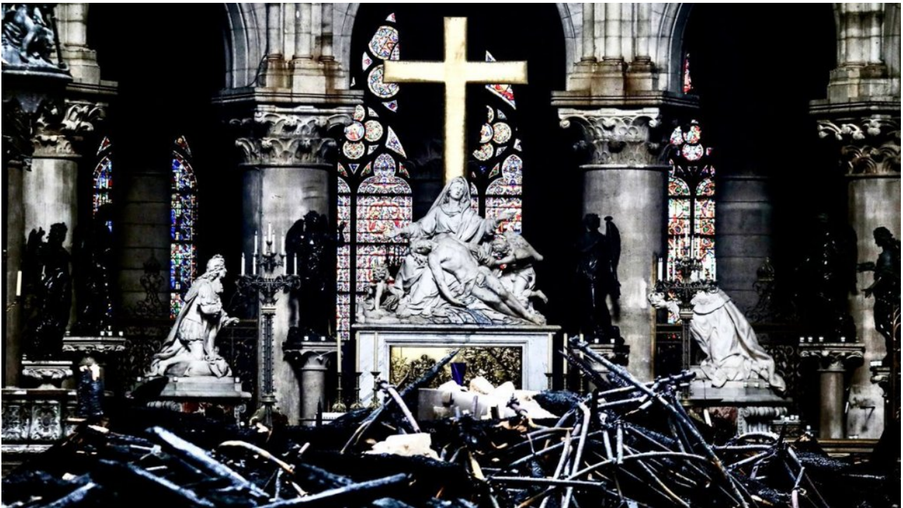
L'altare del vetus ordo intatto (il novus ord, incenerito)

"Per il 2019 lo Stato francese ha previsto solo 18 milioni di euro di fondi per la manutenzione dei monumenti storici che gli appartengono, fra cui 86 cattedrali. Ossia meno di 100 mila euro per monumento".