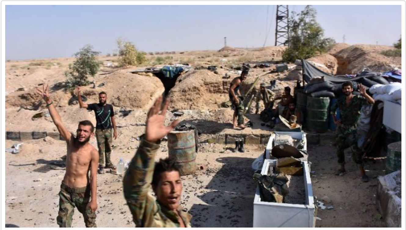
Gli assediati all'arrivo dei liberatori dell'armata siriana https://alshahidwitness.com/syria-isis-deir-ez-zour/