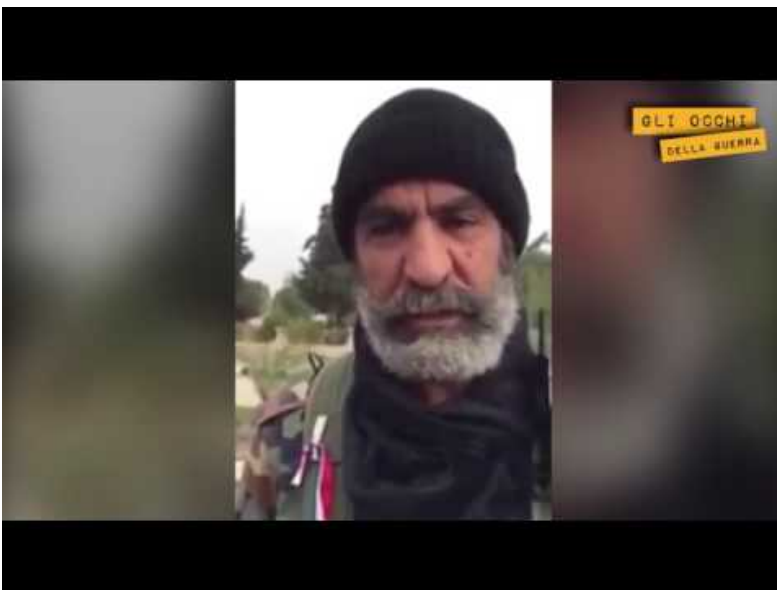
Watch Video At: https://youtu.be/YH1fVU5JJE0