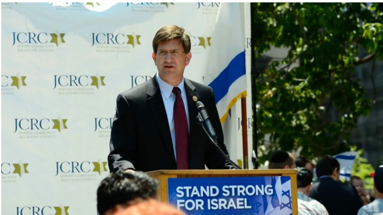
Il rappresentante del Congresso Brad Schneider, sponsor del "Guaranteeing Israel's QME Act of 2020." La foto è del discorso del 17 luglio 2014 a Washington DC, durante l' attacco di Israele a Gaza

La loro ultima soluzione per mantenere il QME israeliano, perciò, comprende la possibilità di dare a Israele il potere di veto su tali vendite di armi da parte degli USA. La soluzione legislativa illustrata dal rappresentante del Congresso Brad Schneider (Illinois) e sostenuta dall'American Israel Public Affairs Committee (AIPAC) è il "Guaranteeing Israel's QME Act of 2020."