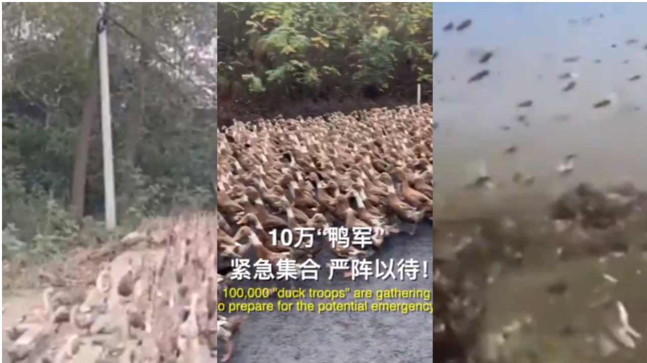
Anatre arruolate contro le locuste

“Quanto alla famiglia di mia moglie: di suo padre non riesce a sapere più nulla, e questo da oltre un mese. Nessuna parola può esprimere il lutto di mia moglie, non so più come sostenerla.