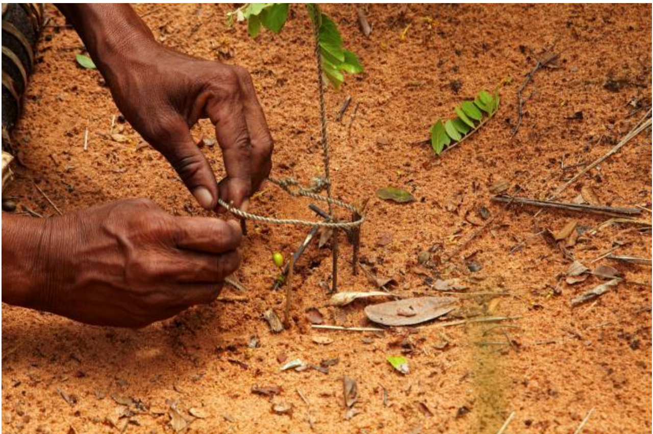
Come impostare una trappola per rullanti – Ju / 'hoansi Living Museum in Namibia