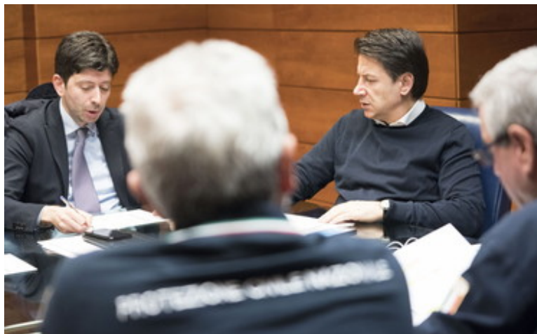
In ascolto del Comitato Scientifico

“Il peggio – rincara Alexandre – è che ne approfittano per difendere con le unghie e coi denti gli interessi e i privilegi della loro classe privilegiata sotto assedio (il 4,9% che s’immagina di essere lo 0,1%) e reprimere in modo crudele e stupido, tutte le altre. Sono i sintomi di una classe dominante arrivata alla propria fine, perché in fine di dominanza. “Si può scommettere che la schedatura universale della popolazione per smartphone, il suo immiserimento per disoccupazione di massa, e il suo dominio attraverso una massa di carta-moneta senza altro valore che quello che gli assegnano “I mercati” e il TG di LA7, non finirà bene. E questo perché la classe dominante non è più capace di gestire un piano troppo sofisticato per lei”.