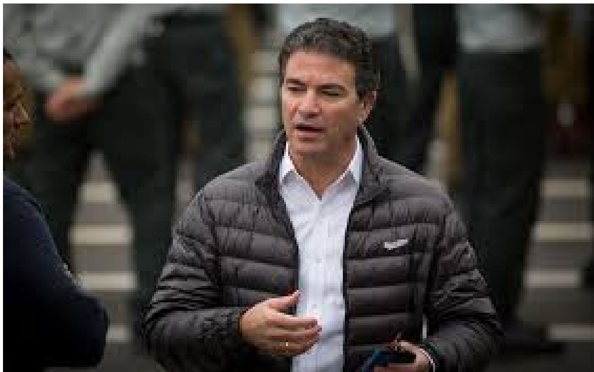
Direttore del Mossad