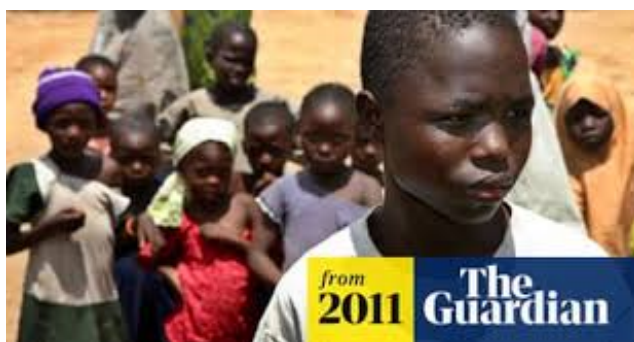
Pfizer coinvolta in scandalo in Nigeria

“Pfizer è tutt’ora oggetto di una controversia legale in Nigeria – leggiamo sempre su Byoblu – perché accusata di aver somministrato un antibiotico sperimentale a un gruppo di bambini malati di meningite . (Vedi: https://elpais.com/sociedad/2007/06/05/actualidad/1180994402_850215.html )