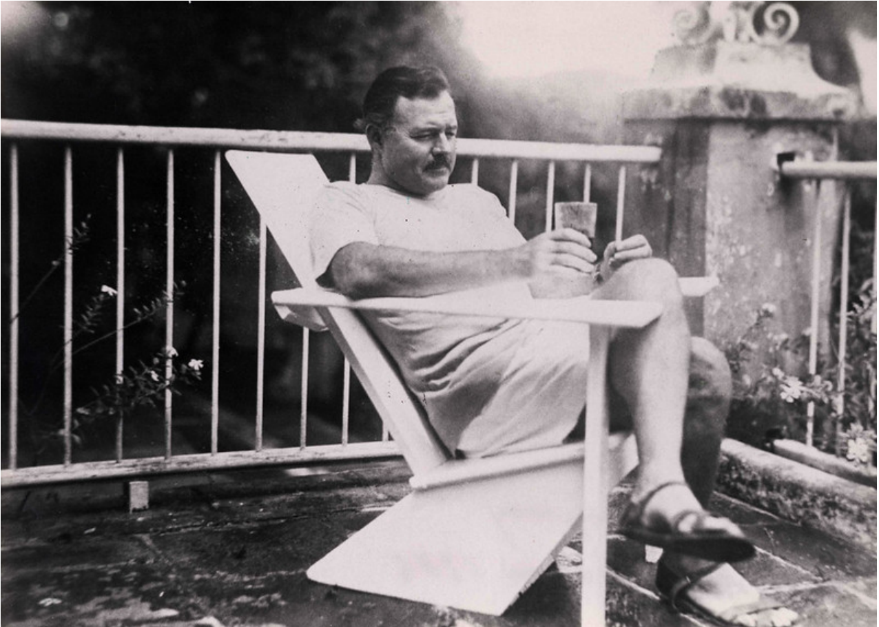
Ernest Hemingway a Cuba.

Lui riteneva lo stesso facendo. Non lo so. Era lo scrittore più famoso della Terra. Viveva a Cuba. Devo presumere che simpatizzasse per la rivoluzione di Fidel Castro. Sapeva quanto fosse corrotto il governo di Fulgencio Batista. Capiva anche, in una sorta di realpolitik, che la casa di Ketchum [Idaho] sarebbe stata una copertura contro la perdita della sua amata Finca [Vigía, la casa di Hemingway vicino all'Avana , che ora è un museo]. In qualche modo, si può sostenere che è stata quella perdita a farlo sbandare definitivamente. Sosteneva che l'Fbi lo controllasse. In base a cosa lo pensava?