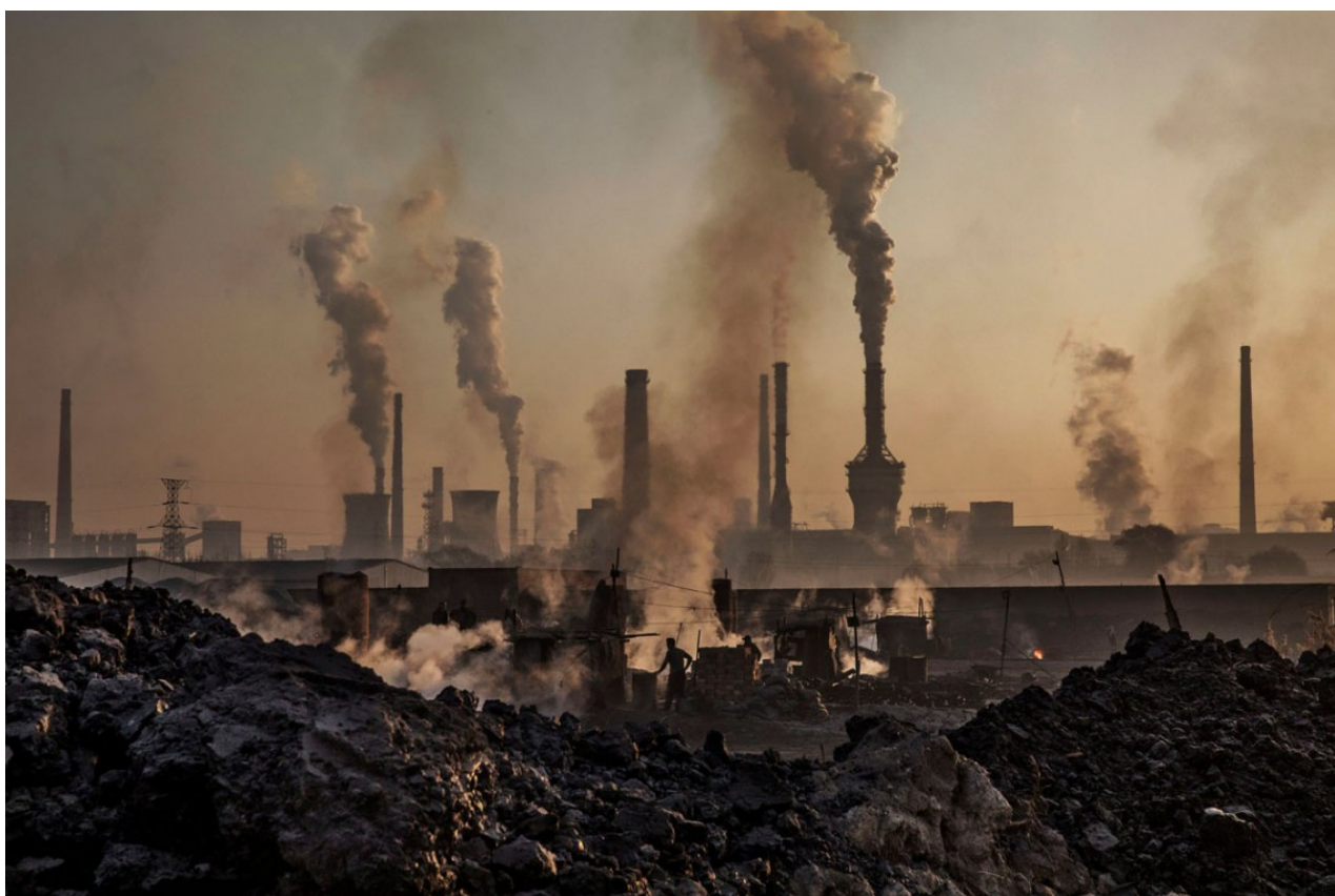
Il fumo esce da una grande acciaieria cinese, 2016.

L'Atlante mappa i conflitti socio-ambientali in 10 categorie principali: nucleare, minerali ed estrazioni edilizie, gestione dei rifiuti, biomasse e conflitti terrestri, combustibili fossili e giustizia climatica/energetica, gestione delle acque, infrastrutture, turismo ricreativo, conflitti per la conservazione della biodiversità, conflitti industriali e dei servizi pubblici.