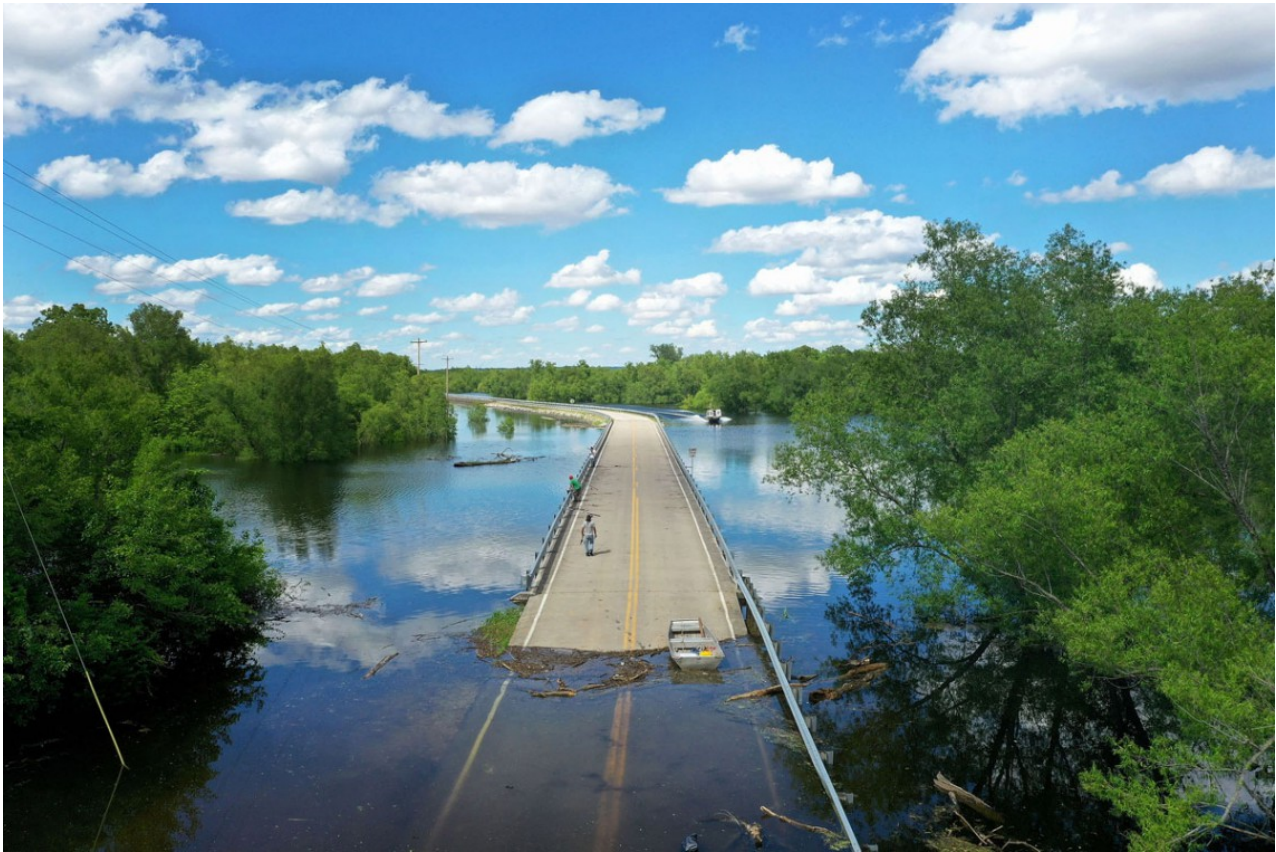
Un'alluvione allaga e danneggia la strada al confine tra il Missouri e l'Illinois, il 30 maggio 2019.