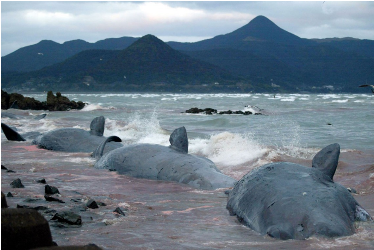
Balene spiaggiate nella città di Oura, sud-ovest del Giappone, 2002.