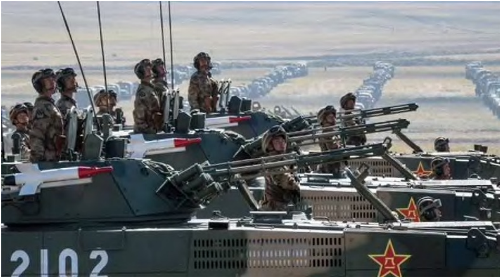
Esercito cinese si esercita vicino a Taiwan

Nel frattempo, Washington e Pechino hanno consolidato le loro rispettive alleanze in mezzo alla crescente rivalità; pur avvertendo di un “rischio reale” di guerra tra le due parti .