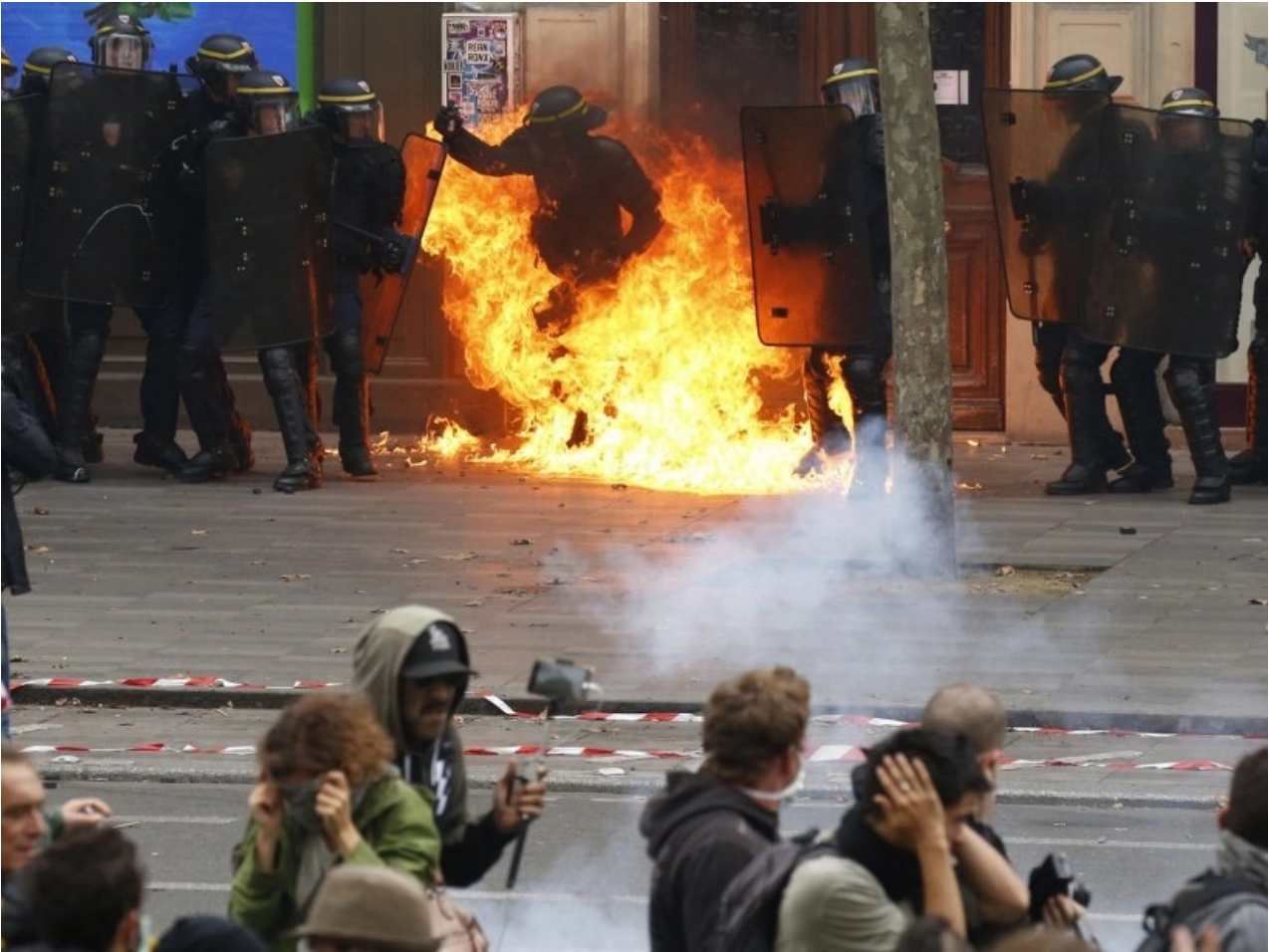
Scontri a Parigi

può impedire » perché « si ripete con la stessa regolarità con cui le stagioni si sostituiscono ». Quindi, » non ha senso piangere e lamentarsi per questo ” o ” avere paura, farsi prendere dal panico o incitare all’odio verso chiunque “, ” bisogna solo darlo per scontato, come una legge di natura e prepararsi come meglio che puoi ”.