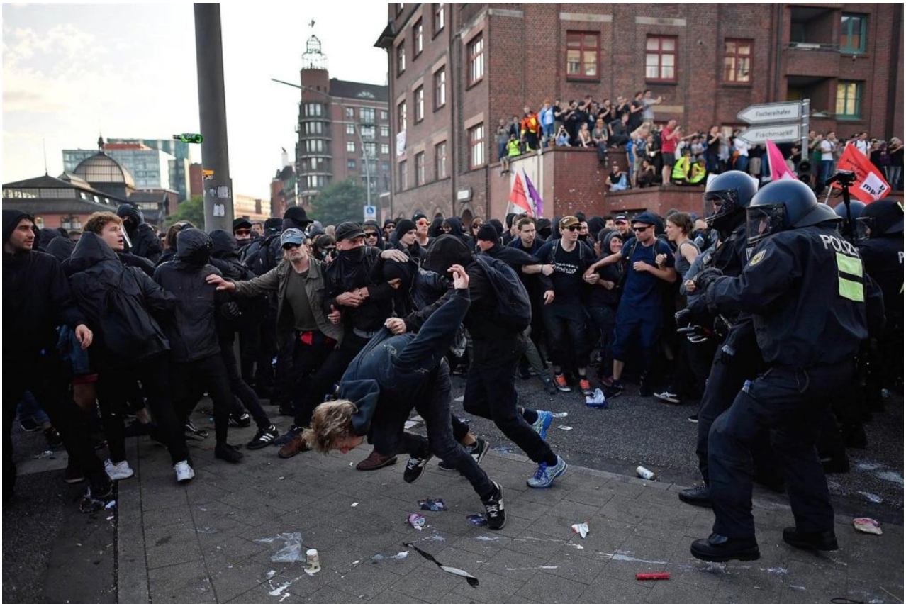
Scontri ad Amburgo

Vede una serie di possibili scenari e tipi di conflitto, incluso un conflitto su larga scala nel sud della Francia con una massiccia rivolta. Specifica che "la maggior parte di questo Paese sarà fuori dal controllo del governo, quindi alla fine dovranno usare l'esercito ". Al di là dello scenario catastrofico per la Francia, pensa che " ci sarà un conflitto tra Russia e Turchia , perché in certe regioni gli interessi di questi due Paesi si scontrano sempre di più, e quindi alla fine un conflitto diretto nei Balcani o nel Mar Nero finirà per scatenarsi". essere inevitabile ". Inoltre, prevede " un conflitto armato tra Stati Uniti e Cina da qualche parte nella regione del Pacifico ", specificando che "si può parlare di plausibili scenari, tendenze, interessi e forze che si scontrano "ma che, quindi, la loro collisione non sarà evitata, perché ad un certo punto " la soluzione pacifica già scomparirà dalla scena " .