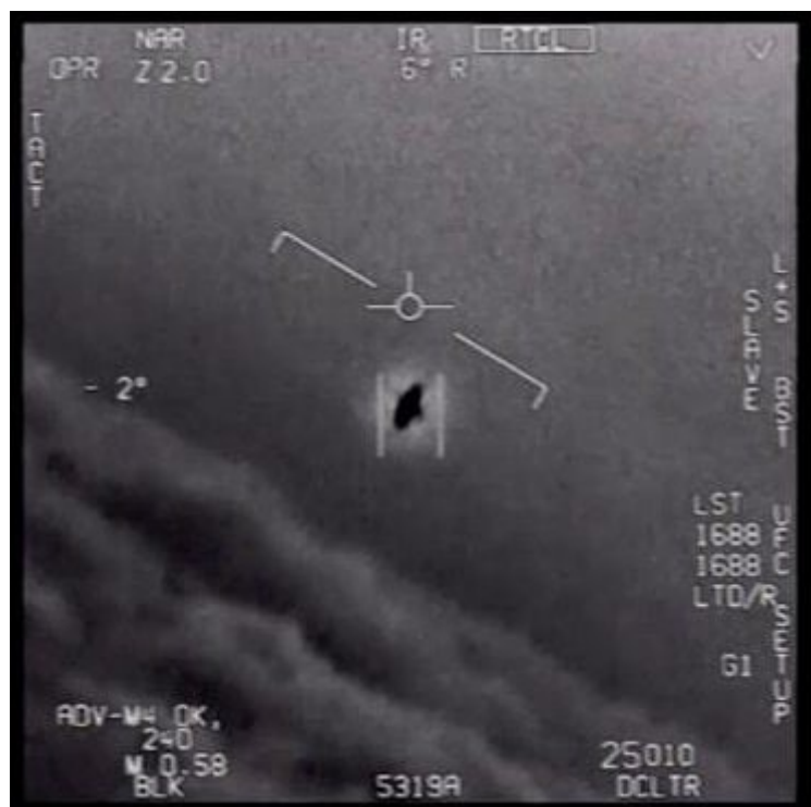
A still from video of the 2004 encounter near San Diego between two Navy F/A-18F fighter jets and an unknown object.

And once-secret intelligence just keeps coming. Last month, footage of bizarre images of flashing pyramid-shaped UFOs was posted online, which the Pentagon confirmed was taken in 2019, by a US Navy ship off California.