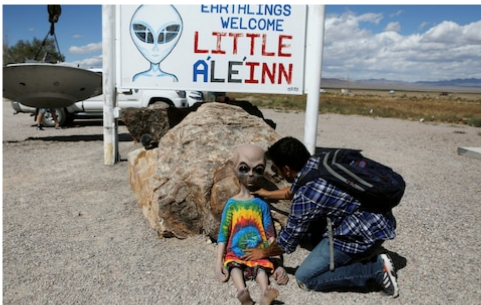
A visitor poses a doll at Area 51, a secretive US military base believed by UFO enthusiasts to hold government secrets about extra-terrestrials

Mr Reid represented the state of Nevada – home to Area 51, the highly classified US Air Force base which has been the subject of many UFO conspiracy theories and Hollywood films.