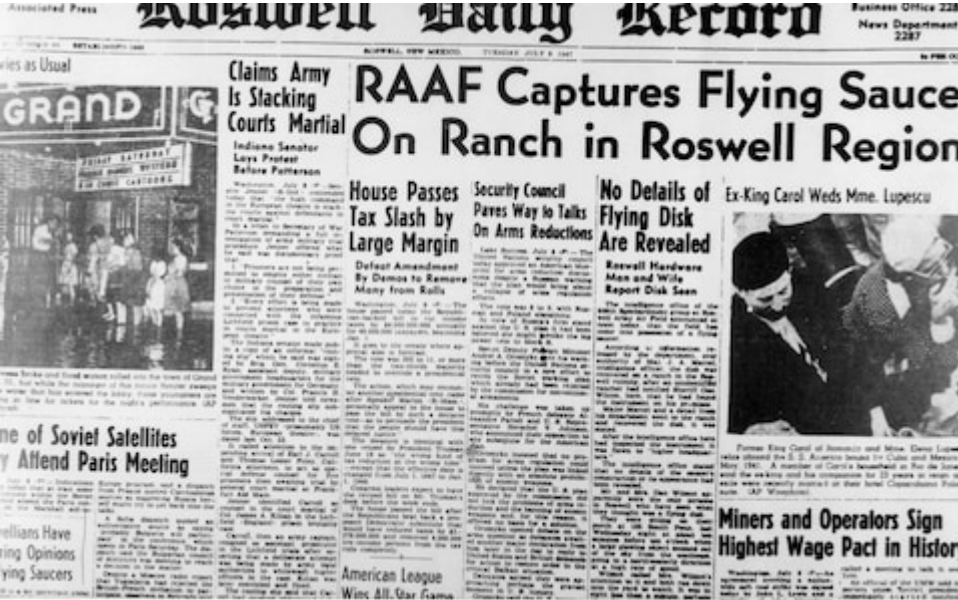
A local newspaper's front page after the Roswell crash

The following month, a farmer found wreckage on a ranch near Roswell, New Mexico. In a press release, the US military called it a "flying disc", but later said it was part of a weather balloon.