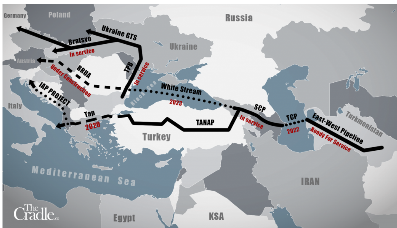
I gasdotti del corridoio Caspio Sud Asia

Il presidente iraniano Raisi ha alluso agli interessi stranieri che stavano provocando incendi e contrasti durante quel periodo acceso dicendo: "Non dobbiamo mai permettere ad altri di interferire nelle nostre relazioni. Dobbiamo risolvere i nostri problemi, lavorare insieme per far progredire le nostre relazioni e approfondire la cooperazione reciprocamente vantaggiosa. L'esperienza finora mostra che quando discutiamo noi stessi dei nostri problemi, riusciamo a risolverne molti".