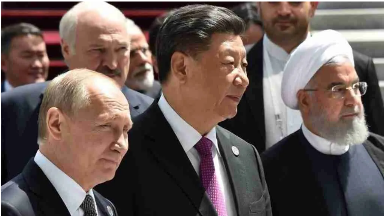
Nuova alleanza Russia Cina Iran

Il rappresentante degli Emirati Arabi Uniti ha dichiarato in cambio: "Siamo i figli di questa regione e abbiamo un destino comune, quindi lo sviluppo delle relazioni tra i nostri due paesi è nella nostra agenda ... speriamo che inizi un nuovo capitolo delle relazioni con i nostri due paesi."