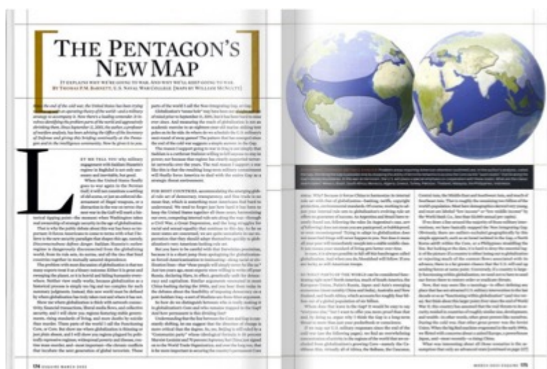
Esquire Magazine, marzo 2003

Poco importa che i governi alleati interpretino queste guerre come vuole la propaganda statunitense; la realtà è che non sono guerre civili, ma tappe di un piano prefissato del Pentagono.