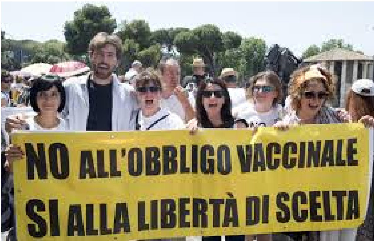
Persones che cercavano di protestare per la libertà di scelta

Il vaccino Astra Zeneca si è attestato su 1 morto ogni 300.000 vaccinazioni secondo le ultime rilevazioni aggiustate ad i decessi di persone che non avevano patologie concomitanti e di cui la storia clinica era nota, con una maggioranza significativa di donne ed uomini sotto i 50 anni.