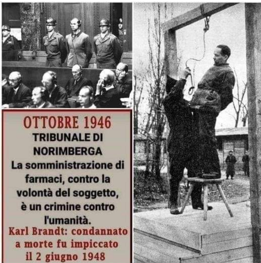
Il medico nazista Karl Brandt giustiziato per impiccagione

«Il consenso volontario è assolutamente essenziale. Ciò significa che la persona interessata debba avere capacità legale di esprimere il consenso; che essa sia nella condizione di poter esercitare un libero potere decisionale senza che si intervenga con la forza, con la frode, con l'inganno, con minacce o esagerando con qualsiasi forma di vincolo o coercizione; che essa abbia sufficiente conoscenza e comprensione degli elementi coinvolti nello studio, tali da permettere una decisione consapevole e ragionata».