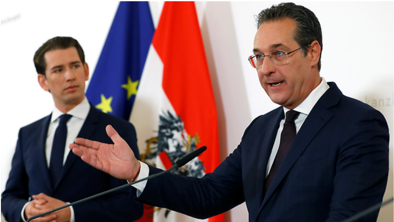
L'ex cancelliere Sebastian Kurz ed il suo vice Heinz-Christian Strache

Kurz, leader dell'Austrian People's Party, però, il 9 ottobre 2021, si è dimesso dopo che nei giorni precedenti aveva ricevuto delle accuse di "favoreggiamento della corruzione". Secondo il procuratore generale austriaco, Kurz, assieme ad altre nove persone, tra il 2016 e il 2018, quando era Ministro degli Esteri, avrebbe usato illegittimamente i fondi del Ministero delle Finanze per manipolare i sondaggi a suo favore e del Partito Popolare Austriaco, nonché agevolare la pubblicazione di notizie favorevoli sui quotidiani austriaci.