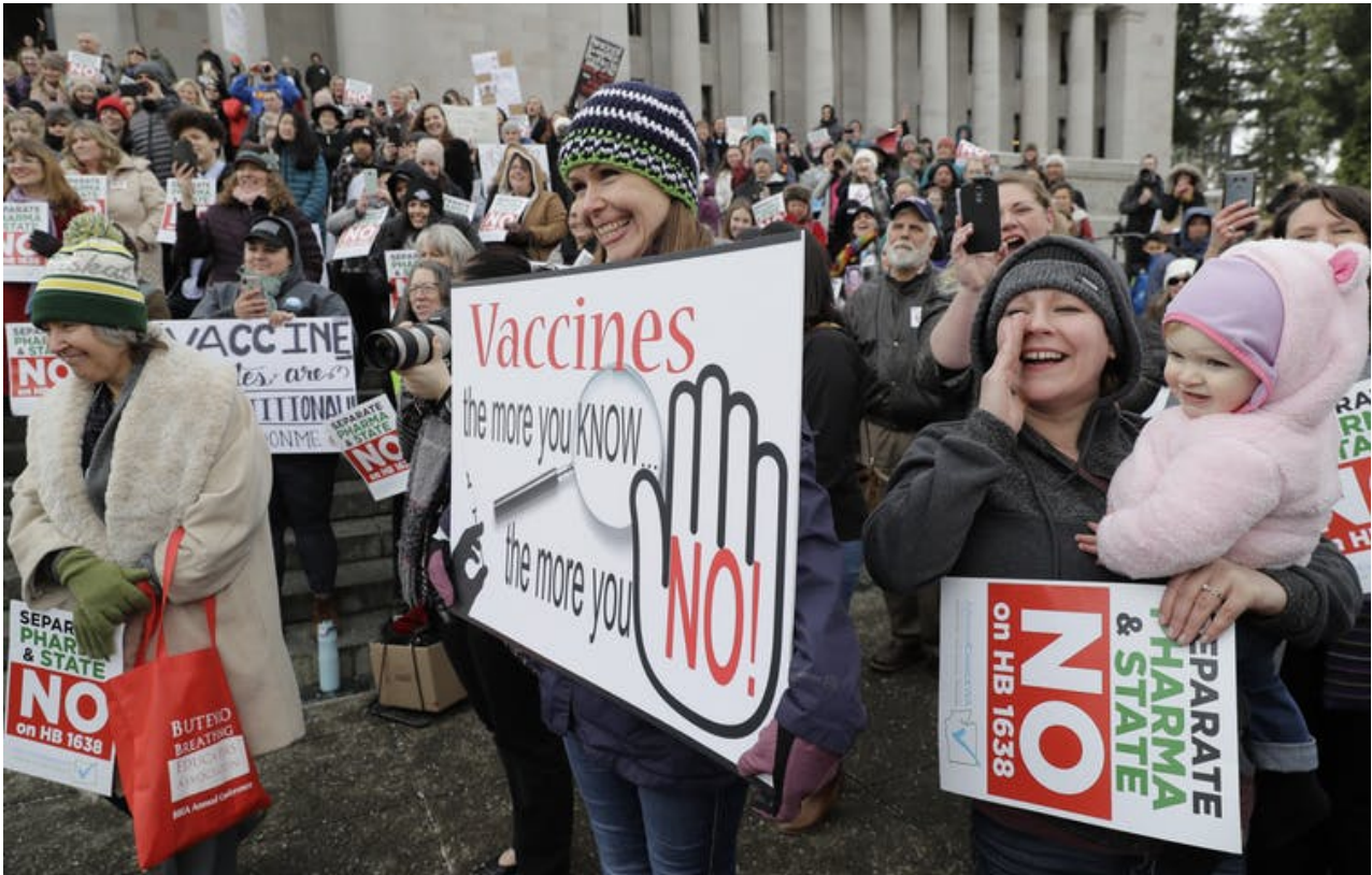
Proteste contro la vaccinazione

La variante Delta attraverserà la popolazione. L'unica soluzione sono le cure. Le cure note sono note e utilizzate da pratiche indipendenti. In India, la Ivermectina ha fermato completamente il Covid nei distretti autorizzati a utilizzarlo. Vedi questo .