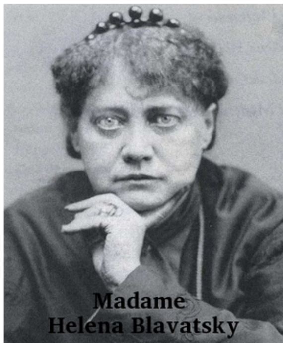
Madame Helena Blavatsky

Sia madame Blavatsky che Alice Bailey sono fondatrici della società teosofica ed erano appartenenti alla massoneria. La società teosofica è sostanzialmente la base ideologica e filosofica della cosiddetta New Age. La New Age è una dottrina secondo la quale Cristo appartiene ad una inesistente "loggia bianca" ed era fratello di Lucifero. Secondo questa dottrina, Lucifero è dio, e lo scrivono chiaramente nei loro libri sia la Blavatsky che la Bailey. Entrambe poi auspicavano la formazione di una religione globale che, nella loro idea, deve essere la religione del governo mondiale.