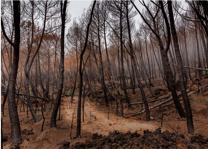
Vesuvio (11-luglio-2017) 2020