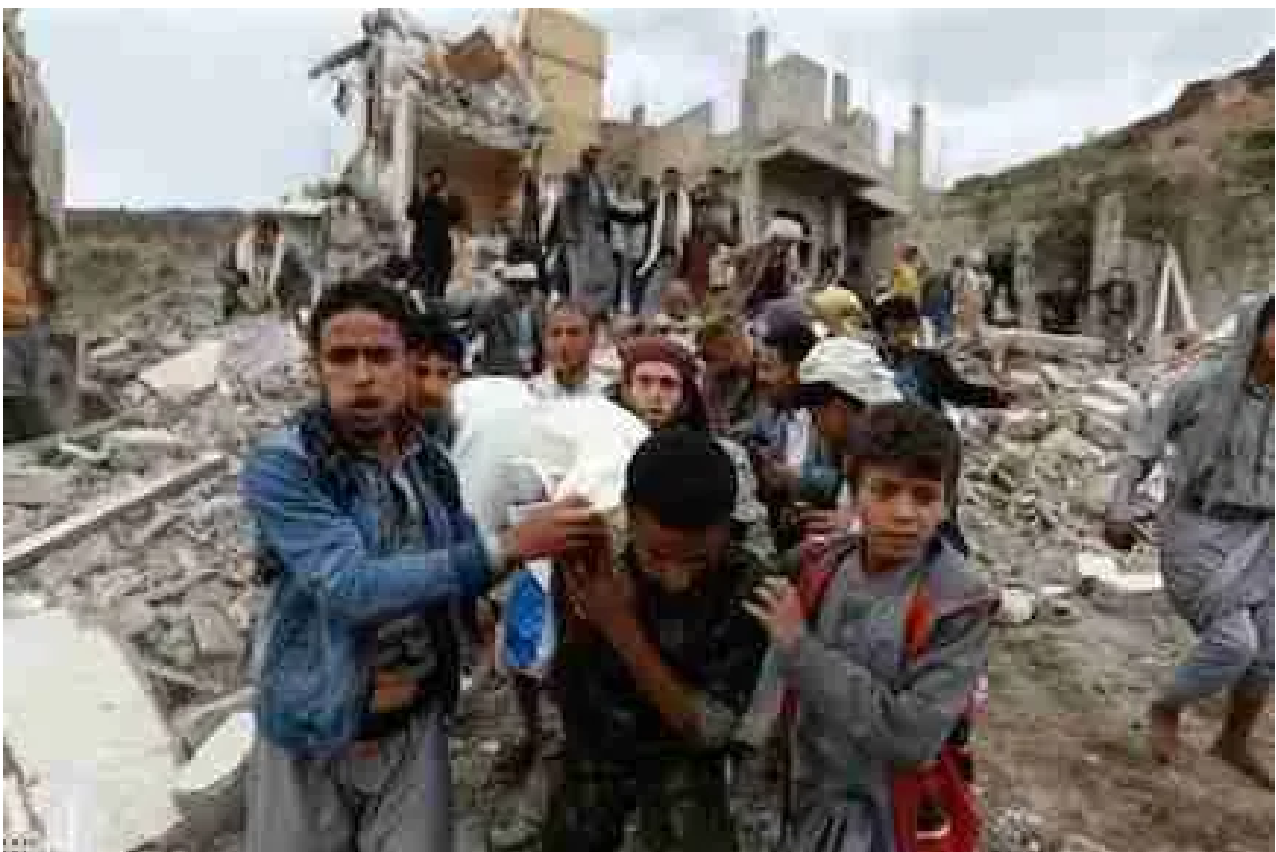
Distruzioni nello Yemen

L'Arabia Saudita e un certo numero di suoi alleati regionali, inclusi gli Emirati Arabi Uniti (UAE), hanno lanciato una guerra brutale contro lo Yemen nel marzo 2015. La guerra doveva eliminare il popolare movimento Houthi Ansarullah dello Yemen e reinstallare l'ex presidente Abd Rabbuh Mansur Hadi, fedele alleato di Riyadh. Il conflitto, accompagnato da uno stretto assedio, non è riuscito a raggiungere i suoi obiettivi, ma ha ucciso centinaia di migliaia di yemeniti.