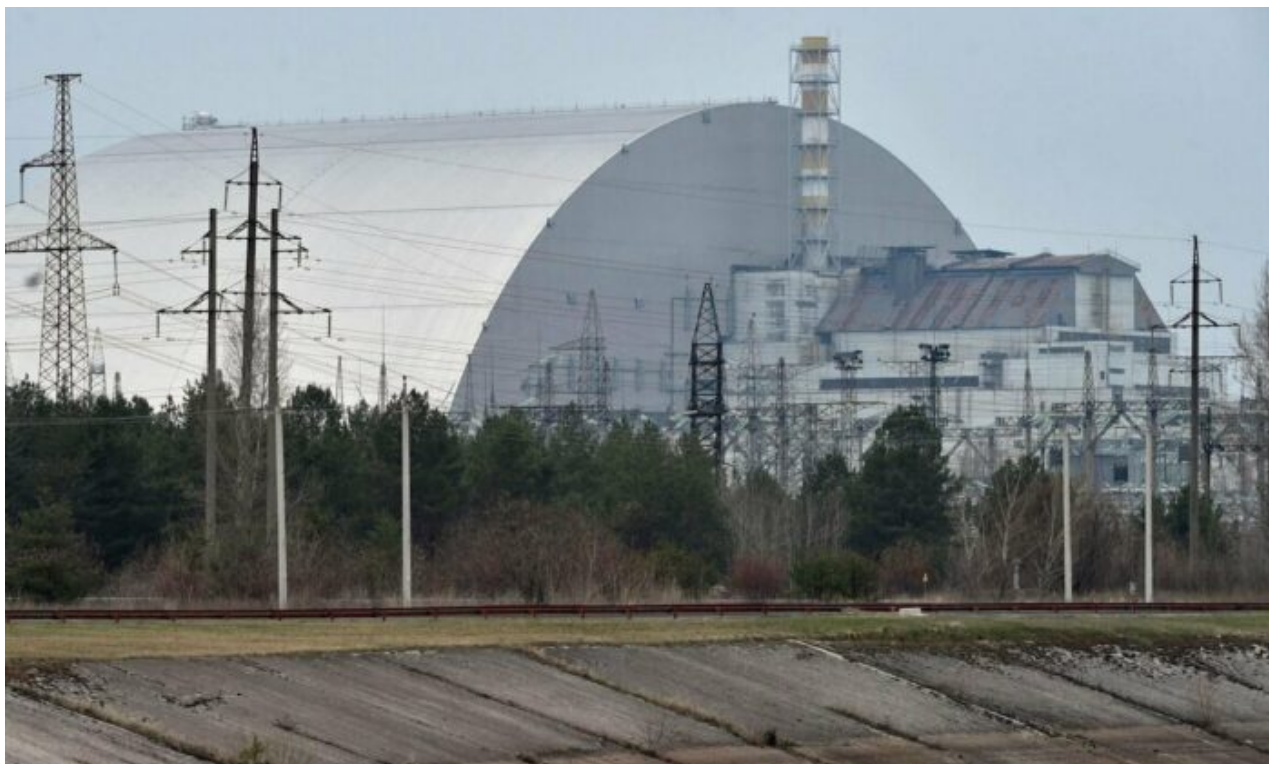
La centrale nucleare di Zaporizhia

Soltanto gli idioti giornalisti di mainstream dell'Italia possono continuare a credere che l'Esercito Russo, impegnato nell'Operazione Militare di protezione del Donbass dopo 8 anni di cruenta guerra civile , possono credere che sia stato lo stesso Cremlino a bombardare l'impianto occupato dai soldati della Federazione Russa.