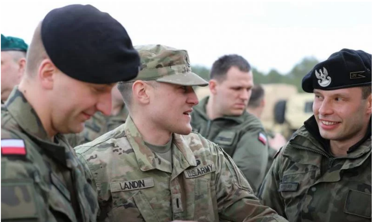
Militari polacchi in Ucraina

Presumibilmente, l'amministrazione Biden potrebbe sperare che una collisione che coinvolga russi e polacchi in qualsiasi forma, inclusi attacchi aerei e missilistici contro le forze polacche sul lato ucraino del confine, potrebbe potenzialmente richiedere al consiglio della NATO di incontrarsi e affrontare l'articolo V della NATO trattato. Non è chiaro se un intervento militare polacco in Ucraina giustifichi l'impegno dei membri della NATO in guerra con la Russia. L'azione sarebbe comunque lasciata al giudizio di ciascuno Stato membro della NATO.