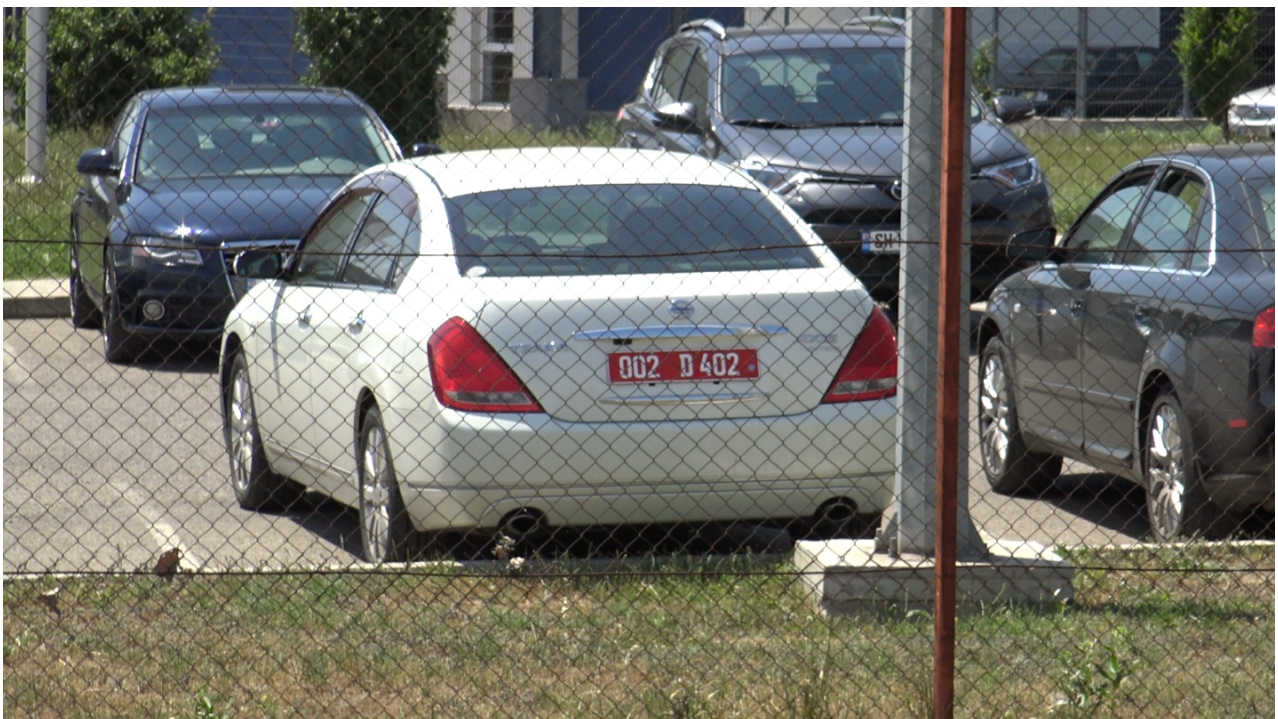
Un'auto diplomatica con targa dell'Ambasciata degli Stati Uniti a Tbilisi nel parcheggio del Centro Lugar. Gli scienziati statunitensi che lavorano al laboratorio del Pentagono in Georgia guidano veicoli diplomatici poiché hanno ottenuto l'immunità diplomatica.

I documenti ottenuti dal registro dei contratti federali degli Stati Uniti mostrano che USAMRU-G sta espandendo le sue attività ad altri alleati degli Stati Uniti nella regione e sta “stabilendo capacità di spedizione” in Georgia, Ucraina, Bulgaria, Romania, Polonia, Lettonia e qualsiasi località futura. Il prossimo progetto USAMRU-G che prevede test biologici sui soldati dovrebbe iniziare a marzo di quest’anno presso l’ospedale militare bulgaro di Sofia.