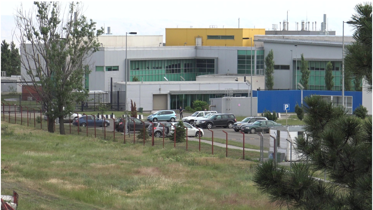
Il Lugar Center è il biolaboratorio finanziato dal Pentagono con 180 milioni di dollari nella capitale della Georgia, Tbilisi.