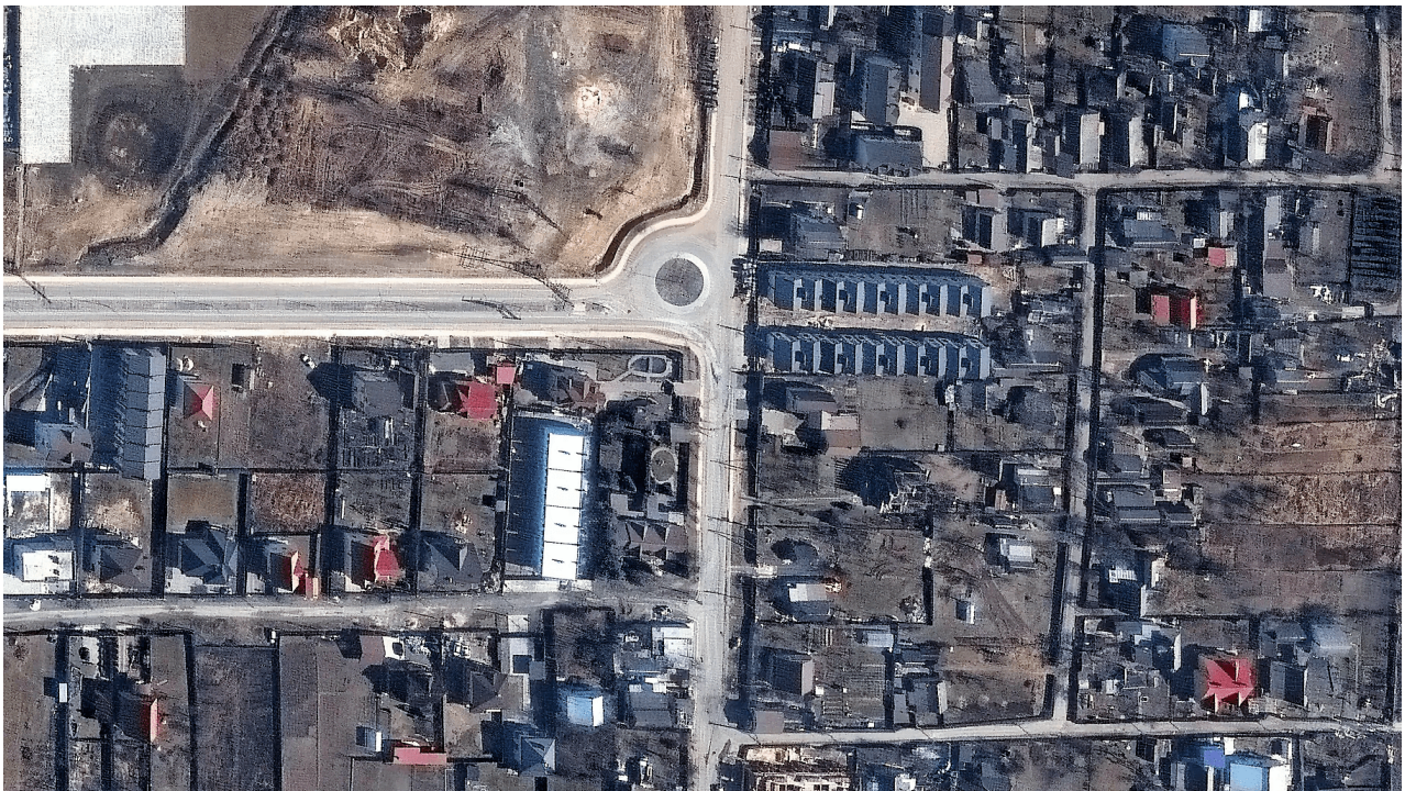
Le foto satellitari

SPERANDO DI SFUGGIRE ALLA CENSURA IMPOSTA NEI PAESI DI "DEMOCRAZIA OCCIDENTALE"