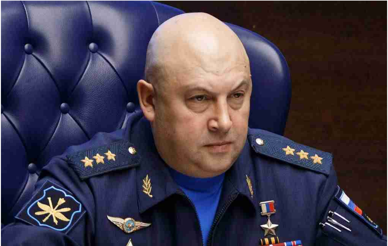
Generale Sergei Surovikin

Surovikin ha annunciato la sua intenzione di formare nuove linee difensive sulla riva sinistra del Dnepr