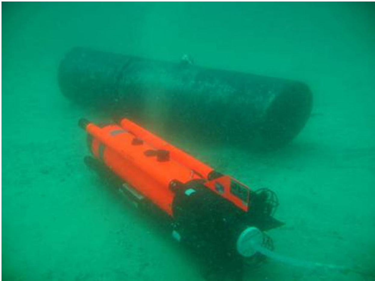
Un drone SeaFox in azione per far esplodere una bomba sottomarina

Il dispositivo è stato trovato appoggiato sul fondo del mare a una profondità di 40 m tra i gasdotti del Nord Stream, quasi direttamente sotto uno di essi, ha detto Kupriyanov.