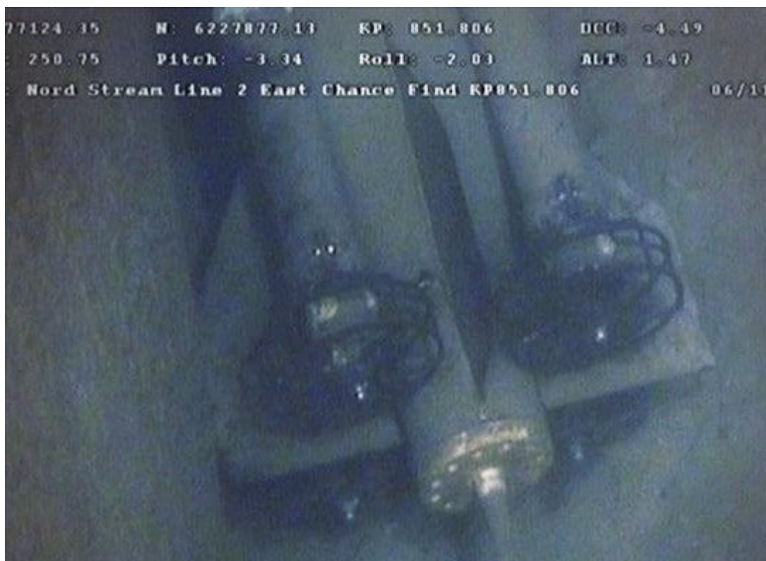
L'immagine del drone diffusa dall'agenzia russa TASS

Ora ecco questo “ricordo” che aumenta i sospetti di un'operazione firmata dal controspionaggio statunitense della CIA , come anticipato da Gospa News, o da quello britannico dell'MI6, l'unità resa famosa proprio dal leggendario James Bond.