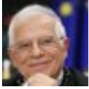
Josep Borrell Fontelles 9 apr 2022

In risposta a @JosepBorrellF 2. #WarCrimes: Brutal attack by Russia against defenceless civilians in #Kramatorsk again shows Kremlin's complete disrespect of human life. It will only increase our support to Ukraine. Meeting tomorrow @IntlCrimCourt prosecutor to discuss tailored support, incl by @EUAM_Ukraine