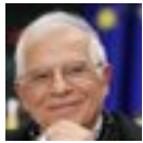
Josep Borrell Fontelles

Le sconvolgenti dichiarazioni bellicose dell'europapavero Borrello si estendono in un thread, una serie di vari tweet.