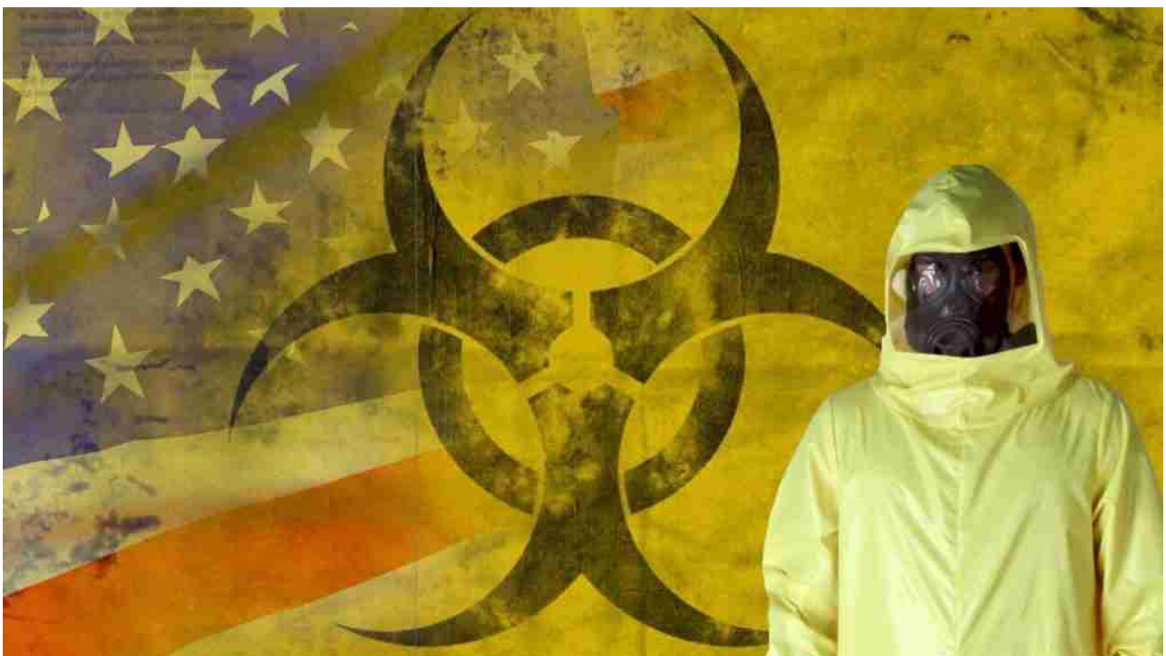
Laboratori biologici USA in Ucraina

“Blinken, Nuland e gli altri responsabili di questo atto atroce sono tornati al governo in posizioni più importanti sotto il presidente Biden e hanno continuato a portare avanti la loro agenda per l’Ucraina”, ha affermato.