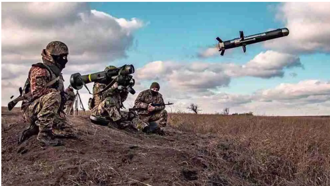
Armi letali all'Ucraina