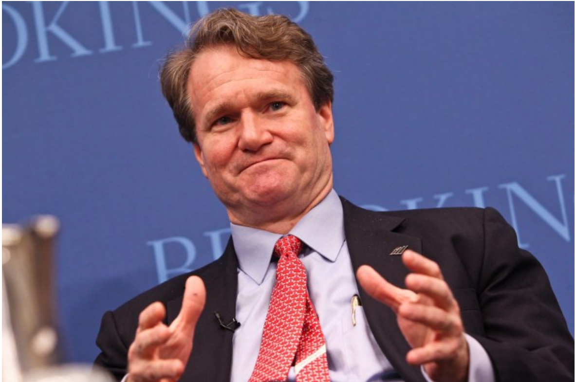
Bank of America CEO Brian Moynihan

Sotto l'articolo originale di Intercept, tradotto in italiano da Contropiano