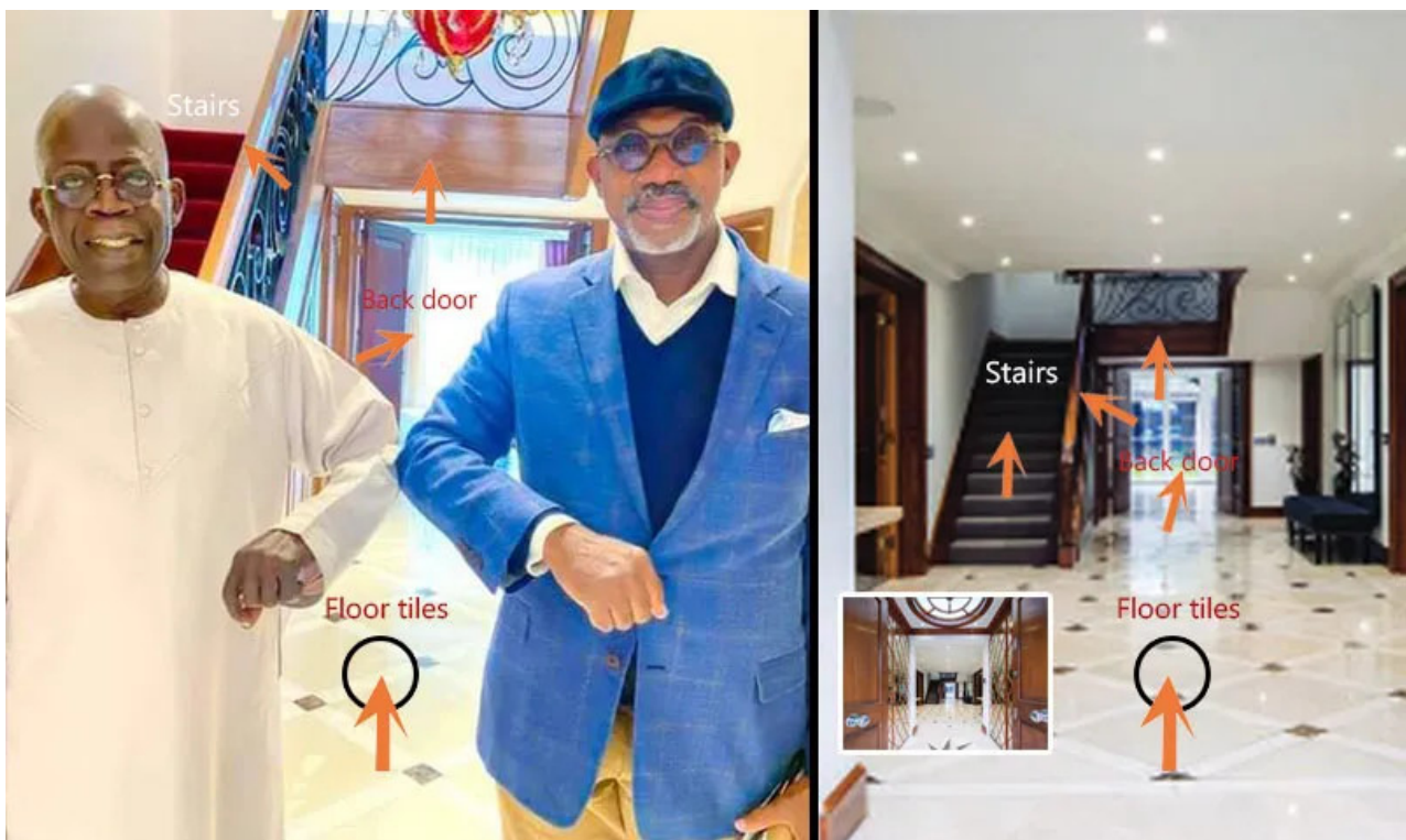
Tinubu nella sua villa di Londra con il governatore nigeriano Dapo Abiodun (grafica di Premium Times).

Ma l'attenzione sgradita sembra aver fatto poco per frenare i gusti stravaganti del politico e Tinubu si è nuovamente trovato coinvolto in uno scandalo di corruzione a seguito di un'indagine sulla lussuosa villa di 7.000 metri quadrati in cui il presidente nigeriano soggiorna quando riceve cure mediche a Londra.