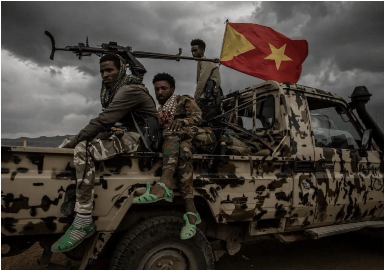
Guerriglieri del Fronte di Liberazione del Popolo Tigrino