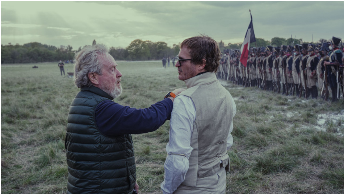
Ridley Scott con Joaquin Phoenix sul set.

politica che seppe travolgere le fatiscenti corti reali e seppe diffondere uno spirito di trasformazione e di rinnovamento. Anche se inconsapevolmente, nei tascapani dei suoi soldati viaggiavano le idee di Jean-Jacques Rousseau e Voltaire. Ogni vittoria contro gli eserciti dell' ancien régime delle corti europee, a prescindere dalle motivazioni personali, era una vittoria del nuovo contro la conservazione. Si dimostrava che si poteva mettere in discussione l'ordine che aveva regnato fino a quel momento. Dal codice Napoleonico al motto secondo cui nel suo esercito «ogni soldato semplice aveva nello zaino un bastone di maresciallo», le armate di Napoleone erano soprattutto l'immagine del cambiamento.